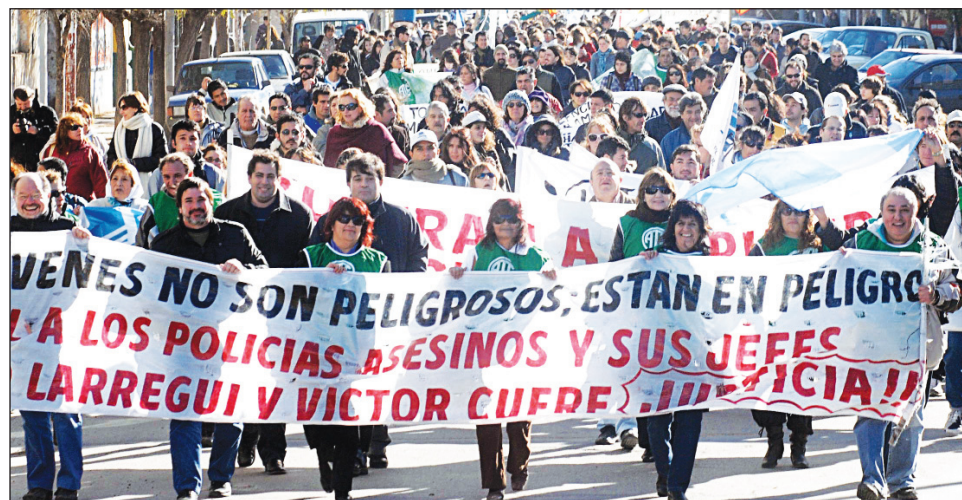
La marcha del 24 de junio. El paro provincial y la gran movilización antirrepresiva fulminó la iniciativa de apoyo a la policía.

Puente Pueyrredón, Gualaguaychú, Bariloche. Video debate en San Martín. Sábado 10, 17 hs. Bonifacini 4692.