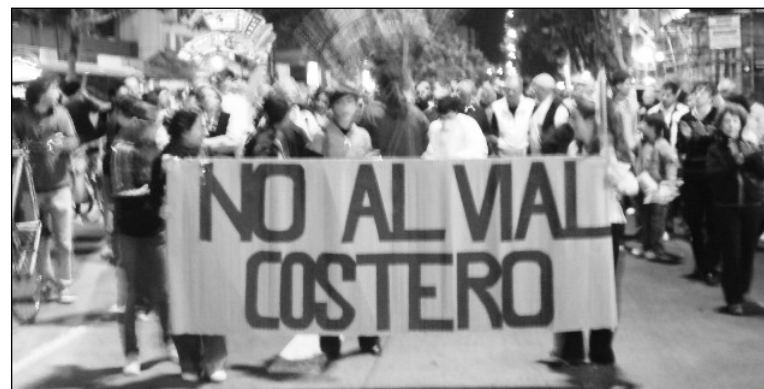
Sigue la lucha de los vecinos. Hace falta un plan de lucha de conjunto.

Hace años que se ha prometido —con actos y actas oficiales— un plan de viviendas populares