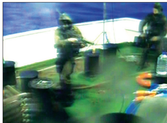
El ejército sionista ataca los barcos humanitarios

El acto de piratería cometido en el Mediterráneo (porque lo ocurrido responde en buena parte a una estrategia deliberada) tiene, sin embargo, una lógica. La caravana humanitaria se había puesto en marcha sin enfrentar contratiempos de parte de los gobiernos de Estados Unidos, Europa y, en la región, de Turquía. Netanhayu enfrentaba una acción ‘destituyente’. Permitir que la caravana perforara el bloqueo de Gaza equivalía a una sentencia política de muerte. En lugar de esto, el gobierno israelí ha llevado la crisis a los Estados Unidos, donde el incidente deberá polarizar aún más las divergencias dentro del ‘establishment’ capitalista acerca del manejo de la crisis capitalista mundial y las guerras en Asia. El crimen del Mediterráneo ha pulverizado la posibilidad de las “negociaciones por proximidad” entre Israel y la Autoridad Palestina. De este modo, la banda de Netanhayu torpedea con cargas de profundidad la sobrevivencia de un gobierno palestino cuyas fuerzas de seguridad, sin embargo, están organizadas y dirigidas por la CIA y cuyo gabinete sigue las orientaciones de Washington.