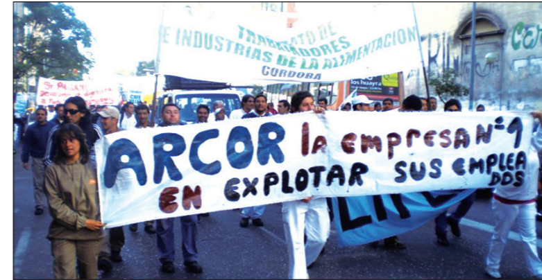
Movilización de los obreros de Arcor, en Córdoba

La conclusión más importante de esta lucha es que se ha procesado una ruptura de los trabajadores con la burocracia; en los debates sobre el acuerdo, los obreros de las tres plantas han hecho explícita su voluntad de sacarse a la burocracia