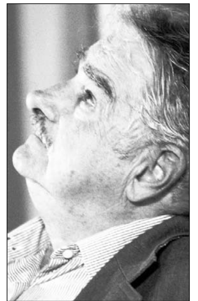
José Mujica, presidente de Uruguay

Las elecciones de intendentes y concejales que se realizó este mes fue "tirón de orejas" para algunos dirigentes del oficialismo, tal como el vicepresidente del país, Danilo Astori, ya que si bien el Frente Amplio retuvo el gobierno de Montevideo por quinta vez consecutiva (desde 1990), la votación estuvo por debajo del 50 por ciento y con retroceso en votos.