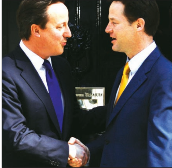
David Cameron y Nick Clegg. Conservadores y liberales, los une el precipicio.

Con más flema que sustancia, los conservadores británicos arreglaron un gobierno de coalición con los liberales demócratas, luego de que los primeros no alcanzaran una mayoría parlamentaria en las elecciones recientes. Los ingleses han etiquetado a los parlamentos sin mayorías como “parlamentos colgados” (de una cuerda, “hung parliament”), pero la coalición supera el obstáculo con un “hung government”. Las coaliciones no traen buenos recuerdos a los ingleses: la primera, entre laboristas y conservadores, ocurrió en la