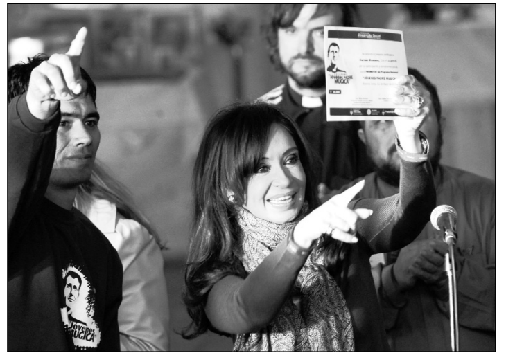
Cristina Kirchner, en el acto en Villa 31.

No hace mucho tiempo, la Presidenta de Argentina confesó que en los '70 había querido cambiar el mundo, pero que ahora se conformaba con la posibilidad de cambiar un barrio.