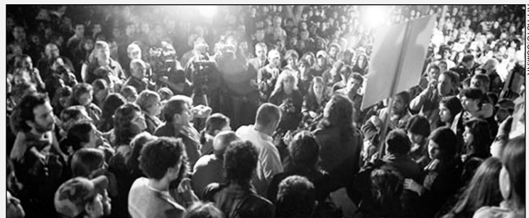
Mercedes, Asamblea popular. Masificar y dotarnos de un programa, para que este crimen no se repita.