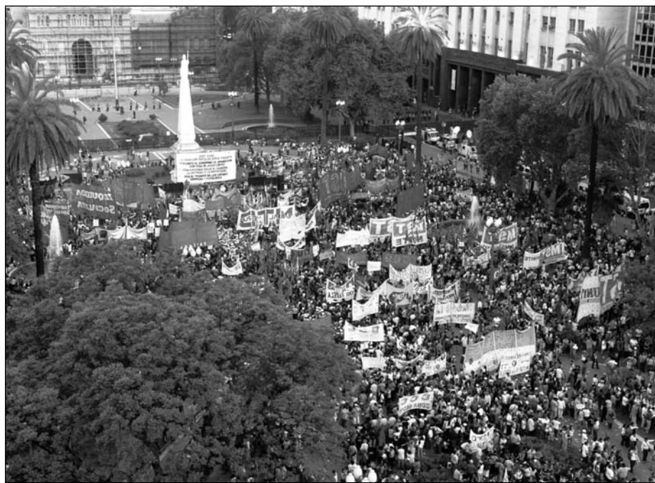
Movilización por el 1º de Mayo. Levantar una tribuna de la clase obrera, para denunciar la política de entrega y ajuste, rechazar el pago de la deuda y luchar por el salario, el trabajo, la salud y la educación.

En Argentina, los capitalistas y sus políticos debaten pagar la deuda con reservas, reconocen que han llevado de nuevo al país a la bancarrota. Han saludado con alborozo el canje de deuda en default por deuda nueva, el cual ya ha dado enormes beneficios a los buitres capitalistas que lucran con la quiebra nacional. Esta maniobra financiera rescata al capital en medio de la crisis y carga con una nueva hipoteca a los trabajadores. Deberemos pagar una deuda mayor y creciente. La Presidenta acaba de ofrecer a su 'enemigo' Macri las garantías del Estado nacional para contraer deuda para la Ciudad a un interés anual del 12% —un 500% por encima de la tasa internacional.