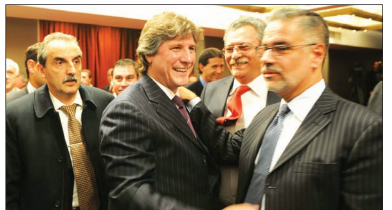
Boudou festeja el inicio del canje de deuda. Fraude, reendeudamiento, default, y una política de encarecimiento y "ajuste" antipopular.