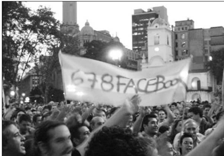
Movilización a favor de la ley de medios. Los K intentan “pegar por izquierda” para “cerrar por derecha” y ocultar su entrega al capital financiero internacional, además de tratar de reconstruir su tropa maltrecha.

A los izquierdistas que fueron al acto K no se les puede pasar por alto que la defensa de la “libertad de expresión” por parte de la bu-