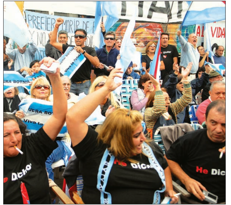
Corte de ruta de Guaqueguaychú. El piquete ha servido para desarrollar la conciencia ambiental y para desenmascarar al gobierno y a todos los políticos del sistema.

La descalificación del fallo por parte de los asambleístas y del movimiento popular obedece a la