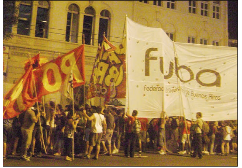
Congreso de la Fuba, un triunfo por partida doble. Se trata de profundizar el camino de la lucha y transformar a la nueva generación en una fuerza revolucionaria junto a los trabajadores.