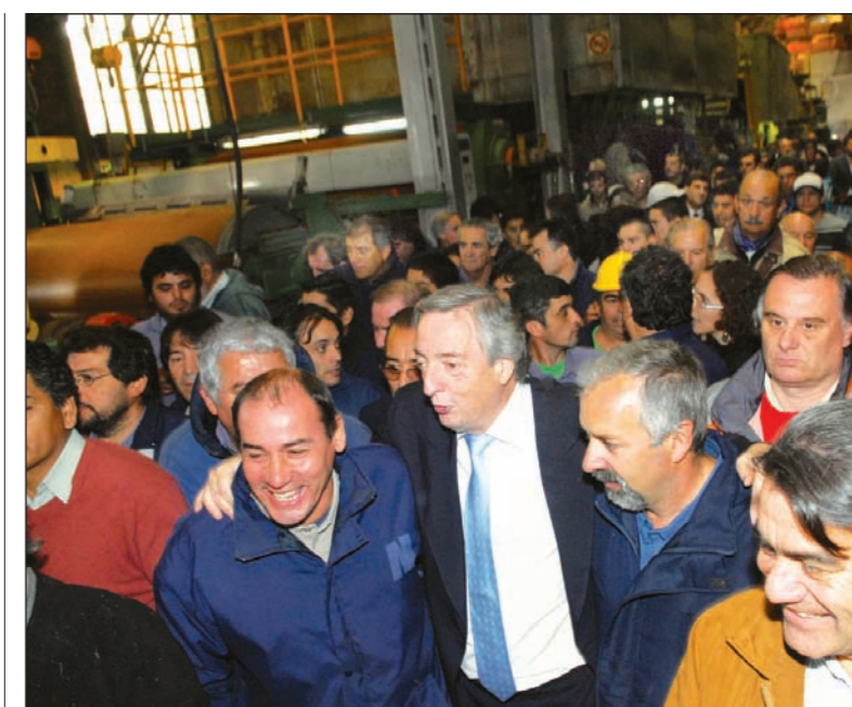
Kirchner en Massuh. La salida K fue un fiasco, para salvar la fuente de trabajo no queda otra que la expropiación.