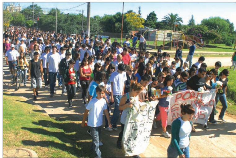
24 de Marzo en Baradero. El Partido Obrero propone convocar a una Asamblea Popular