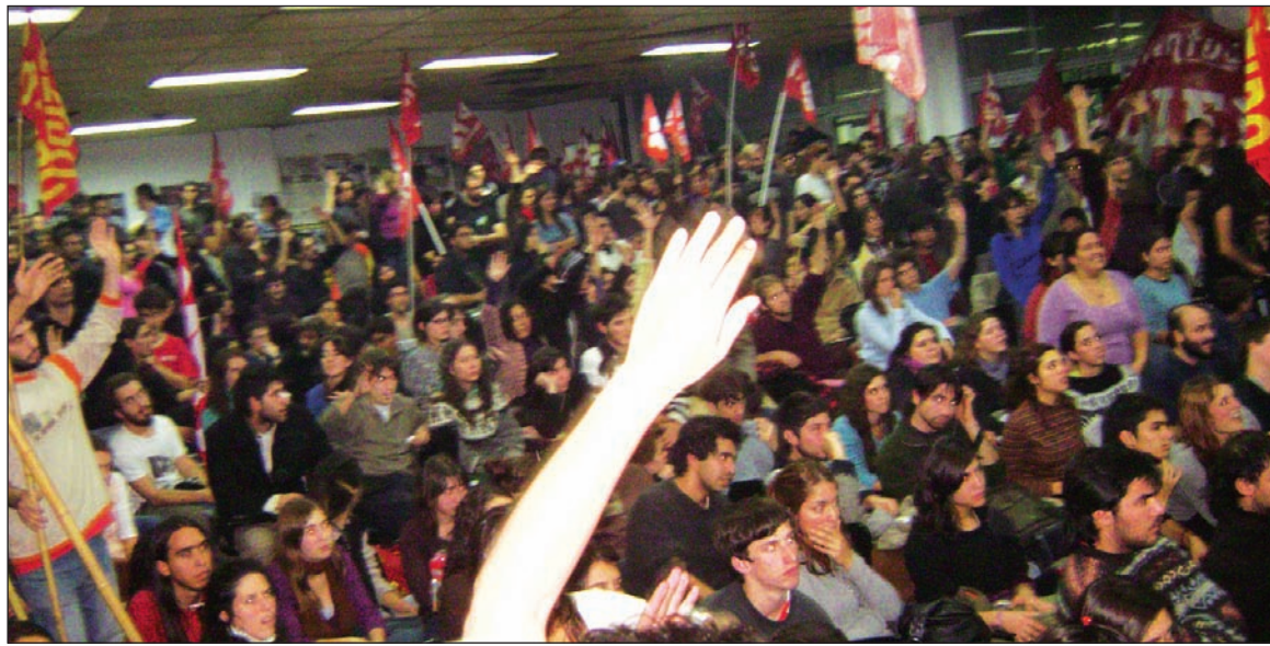
Votación en el congreso de 2008. Todas las fuerzas políticas que se declaran combativas deben asumir la responsabilidad de la defensa de la Fuba como federación de lucha, independiente del gobierno, de las camarillas universitarias y de los partidos patronales.