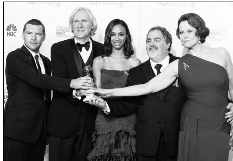
Avatar en la entrega de los premios Globo de Oro. Hollywood necesita apelar al sentimiento antinorteamericano para rescatar su negocio y su dominación cultural.

Ocurre que el pesimismo de largo plazo está motorizado por la colaboración brindada al capital en el corto plazo. Avatar no es el pro-