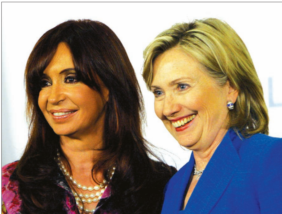
Hillary Clinton, secretaria de Estado norteamericana, festejó el "desendeudamiento" del gobierno K.

En oposición a los "atrakos", es necesario aumentar y defender el salario, nacionalizar sin pago la banca y repudiar la deuda con los usureros.