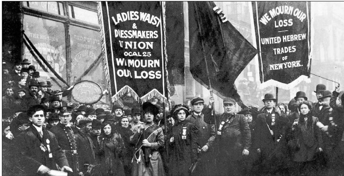
Movilización de obreras judías textiles de Nueva York, en 1911. Las mujeres estaban ocupando un vigoroso lugar en las luchas de la clase obrera

H ace un siglo, un centenar de delegadas de partidos y sindicatos socialistas, llegadas de 17 países a Copenhague (Dinamarca), votaron que las socialistas llamarían a una jornada anual de lucha por la emancipación de la mujer, el Día Internacional de la Mujer Trabajadora. La II Conferencia Internacional de Mujeres Socialistas sesionó el 26 y el 27 de agosto, constatando que las mujeres estaban ocupando un vigoroso lugar en las luchas de la clase obrera, al punto de “convertirse en una fuerza social que no puede ser ignorada en el proceso de la lucha de clases”, según la delegada rusa, Alejandra Kollontai. El sector más oprimido y atrasado del proletariado había salido a luchar osadamente por la reducción de la jornada laboral, el salario, las espantosas condiciones de trabajo, en solidaridad. Cientos de miles se habían sindicalizado—150.000 sólo en Inglaterra— y muchas militaban en los partidos socialistas. En 1907, el Partido Socialdemócrata alemán tenía 10 mil afiliadas; en 1910, 82 mil. El periódico La Igualdad , que dirigía Zetkin, tenía una tirada