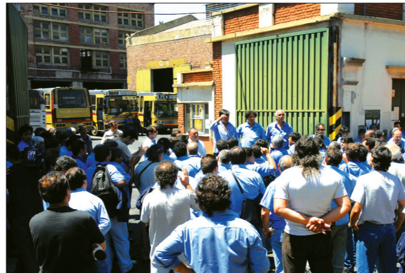
Asamblea de choferes de la 60. La patronal se ha subido a una política inflacionaria; hay que prepararse para reclamar un régimen de actualización salarial trimestral y la incorporación de las sumas en negro al básico.

El gobierno opera también con la premisa inflacionaria, al igual que los gobiernos provinciales, los cuales no previeron aumentos en los presupuestos para deprimir las expectativas sindicales y luego afrontar las migajas que otorgan mediante el inflado de la recaudación tributaria por los aumentos de precios. La recaudación de febrero aumento 20% por esta vía, varios puntos más que el 12,5% de aumento de los docentes bonaerenses para la primera mitad del año. El gobierno kirchnerista es factor activo de la inflación aumentando tarifas, emitiendo dinero y tal vez "soltando" el dólar, si se presenta un nuevo escape