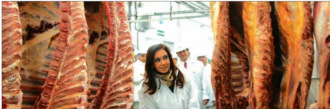
Los aumentos de la carne llegaron para quedarse. Después del derrumbe de los controles oficiales, hay que defender sobre todo el salario.

La inflación está empujada, también, por las tasas astronómicas de interés, que es también el resultado de la bancarrota del Estado, que financia el pago de la deuda pagando intereses usura-