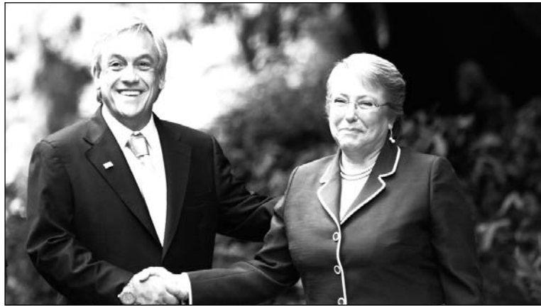
Sebastián Piñera y Michelle Bachelet

to. Al igual que en el pasado, la reacción derechista triunfó por la incapacidad del 'progresismo' para movilizar a las masas y por sus propios lazos: en 1973 con el golpe, ahora con la derecha. La caída de Allende no fue responsabilidad de 'la ultrazquierda', que no fue la que nombró al Pinocho como ministro de Defensa y comandante en jefe, sino por el desarme compulsivo, ejecutado por la Unidad Popular, de los trabajadores dispuestos a defender el gobierno que habían elegido. En lugar de mirar para otro lado, los bolivarianos y nac & pop de América del Sur deberían convocarse en una asamblea general de emergencia.