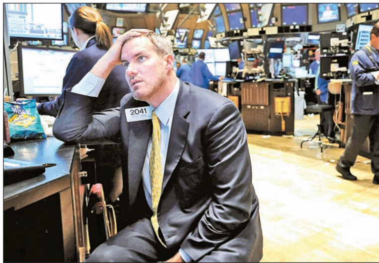
“Catastrofismo”. El valor promedio de las acciones de la Bolsa de Nueva York es inferior al de diez años atrás.

Lo que el artículo del Wall Street Journal no dice es que el derrumbe comenzó cuando los gurues de la economía mundial celebraban, exactamente hace diez años, el crecimiento “extraordinario” e “imparable” de la Bolsa. El 29 de marzo de 1999, el índice Dow Jones, que mide el precio de las acciones, había al-