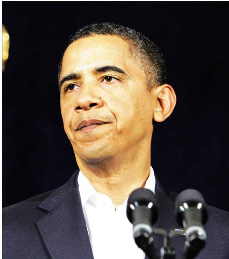
Barak Obama. Como Carter, comenzó con los derechos humanos y se encamina a un final de crisis.

Un reciente artículo, en el The Wall Street Journal , apuntó con mucho sentido de la oportunidad que el gran alza bursátil de la última década solamente tuvo lugar luego de la invasión de Irak (hasta, naturalmente, el derrumbe financiero de 2007). Con la ampliación de la “guerra global contra el terrorismo” a Yemen, el imperialismo yanqui está provocando lo que su presidente habría proclamado que quería evitar: una guerra de conjunto contra las naciones islámicas. Al desmentir la posibilidad de que fuera a abandonar el propósito de cerrar la base de Guantánamo, Obama dio a entender que es precisamente eso lo que están buscando sus servicios secretos.