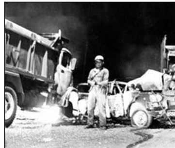
Monte Chingolo. Un acto desesperado de huida hacia adelante que terminó en masacre