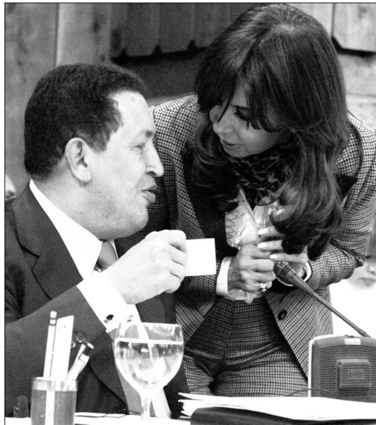
Chavez pretende construir una nueva internacional con la burguesía.

Dicho todo esto, es incontrovertible que es necesaria una In-