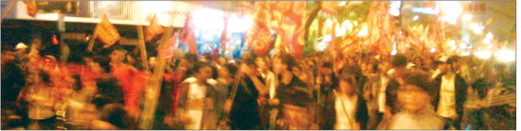
A pesar de la lluvia del sábado, la UJS no se quedó con las ganas de movilizarse por el centro porteño.

POR LA ORGANIZACION SOCIALISTA DE LA JUVENTUD