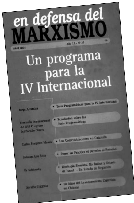
"Un programa para la IV Internacional". Aprobado en el congreso de la CRCI realizado en Buenos Aires, en 2004.