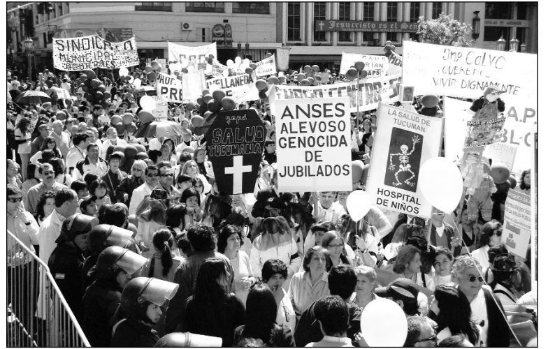
Viernes 13 de noviembre. 18.000 mil marcharon por la salud y contra la represión.

Cuando en los hospitales se conoció la orden de evacuación del personal policial que ocupaba los hospitales, los trabajadores se agruparon y con cánticos como “les damos la despedida, les damos la despedida, ...y que no vuelvan nunca más”, daban cuenta que el control de los hospitales había vuelto a pasar a mano de los trabajadores en lucha.