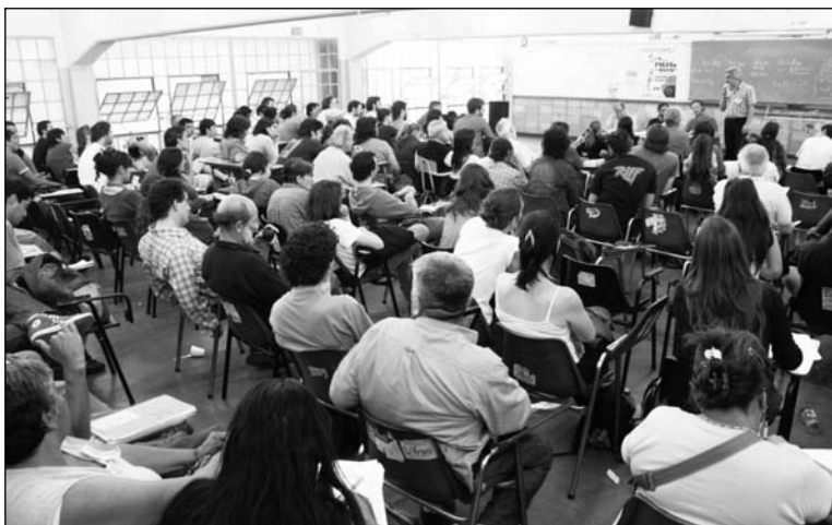
Conferencia Sindical Clasista. Una imagen del debate en comisiones.