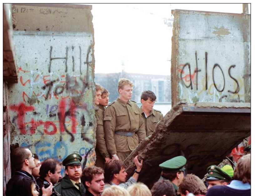
9 de noviembre de 1989, una "semi-revolución". Cada uno por sus propios intereses, la burocracia reformista, el imperialismo y las masas concurren al derrumbe del Muro; pero la dirección política quedó en manos de las corrientes que propugnaban la integración al capitalismo mundial.

—bastante antes de la caída del Muro— una política de "reformas".