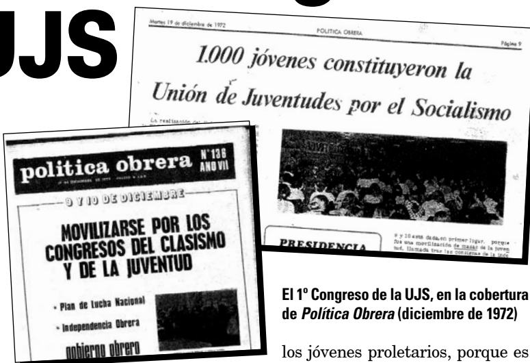
El 1º Congreso de la UJS, en la cobertura de Política Obrera (diciembre de 1972)

Asistimos hoy a una profundización de este fenómeno y por lo tanto a una reafirmación de la necesidad de nuestra tarea: las juventudes políticas están virtualmente desaparecidas de la escena de la lucha de clases, fruto de la renuncia de todos los actores políticos a la tarea de orga-