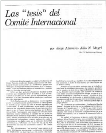
Facsimil de Internacionalismo N° 3 (agosto de 1981). Tempranamente advertimos que la consigna de la "unidad" de Alemania podía llenarse de un contenido contrarrevolucionario.