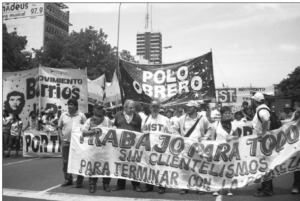
15.000 manifestantes marchando por la avenida 9 de Julio, con una importante presencia juvenil, el sector más golpeado por la desocupación. Alumbra un nuevo movimiento de lucha de los desocupados