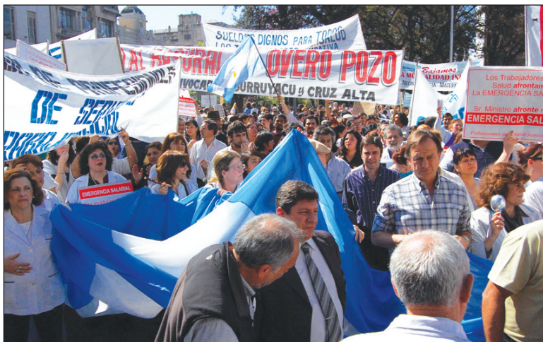
Movilización de los trabajadores de la salud en Tucumán. La reacción popular a los atropellos de Alperovich será 'reventar' la Plaza Independencia el próximo viernes.

Un numeroso sector de delegados rechazó de entrada someterse a la agenda del gobierno y la Iglesia, y que la prioridad era garantizar la segunda marcha de antorchas, que por lo tanto se postergara la