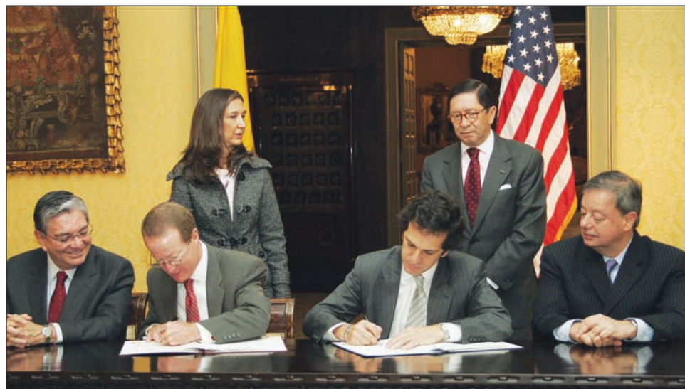
"La lucha contra el narcotráfico es secundaria". Representantes de Colombia y Estados Unidos firman un pacto que permite ampliar la presencia militar norteamericana en toda América del Sur.

ca la importancia de la base militar de Palanquero y habla sobre la necesidad de invertir 46 millones de dólares para acondicionar la pista aérea, las rampas y varias otras instalaciones de la base para convertirla en una Localidad de Cooperación en Seguridad (CSL) de Estados Unidos. "Estableciendo una Localidad de Cooperación en Seguridad (CSL) en Palanquero se apoyará la Estrategia de Postura del Teatro del Comando Combatiente (Cocom) y demostrará nuestro compromiso con la relación con Colombia. El desarrollo de este CSL nos da una oportunidad única para las operaciones de espectro completo en una sub-región crítica en nuestro hemisferio, donde la seguridad y estabilidad están bajo amenaza constante de las insurgencias terroristas financiadas por el narcotráfico, los gobiernos anti-estadounidenses, la pobreza endémica y los frecuentes desastres naturales".