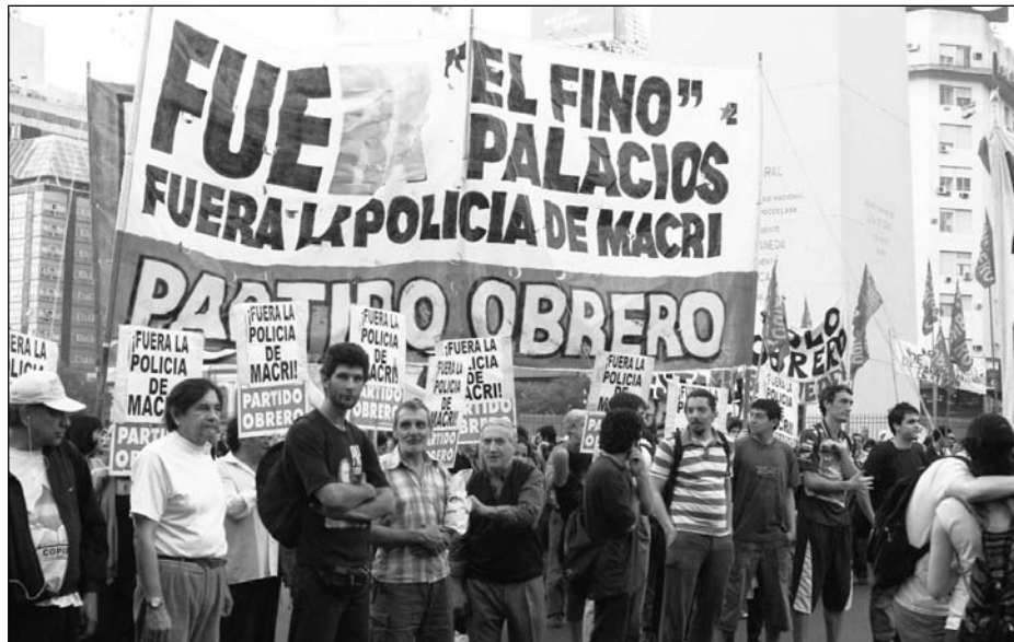
Pasado y presente. Palacios "fue", pero la Metropolitana sigue en pie

La respuesta de Macri revela una crisis general del armado precario que dio origen a la fuerza. La Metropolitana se armó sobre la base de un acuerdo entre el gobierno nacional y el de la Ciudad: los K votaron la ley de seguridad de la Ciudad