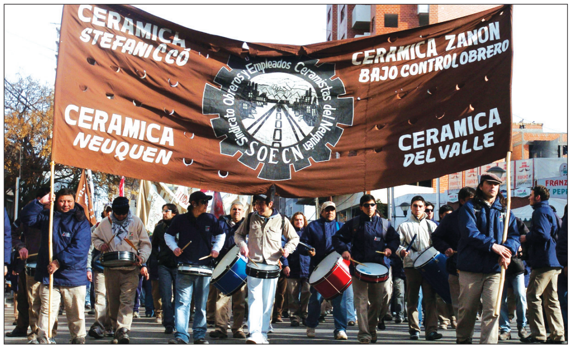
Las limitaciones de la "ley de expropiación" salieron a la luz.

En el comunicado, el sindicato ceramista afirma, asimismo, que "desde 2008 venimos discutiendo con el Poder Ejecutivo de la provincia... también políticas que garanticen la continuidad de nuestra fuente de trabajo, igualdad de condiciones que el resto de la industria