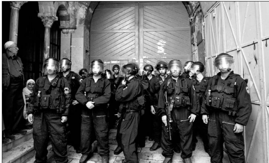
El gobierno sionista militariza el este de Jerusalén.