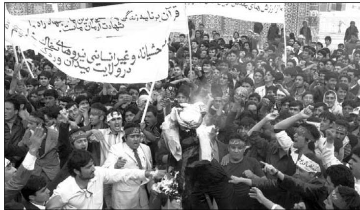
Movilización antiimperialista en Afganistán

Algunos analistas ( Stratfor , 20/10) sostienen que McChrystal requiere 40.000 soldados adicionales para saturar de tropas las zonas más densamente pobladas; esto le permitiría abandonar las bases aisladas en regiones remotas, que son blanco frecuente de los ataques talibanes. En esas zonas, McChrystal recurriría al uso masivo del poder aéreo para aplastar a los talibán. Las mismas fuentes indican que