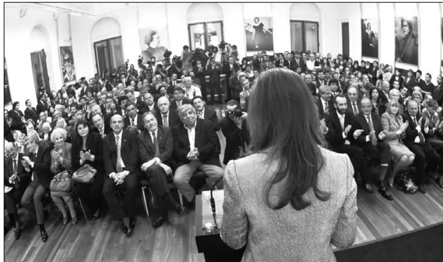
Reforma. La Presidenta anuncia en la Rosada el “corralito” político

Con la reforma, el gobierno también arrojó una piedra al río revuel-