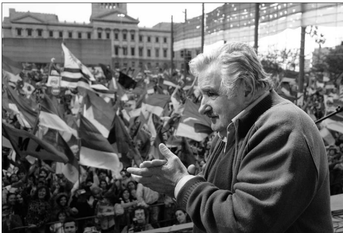
La campaña de Mujica ratificó el papel del FA como correa de transmisión del imperialismo.

Sin embargo, la asimilación del gobierno de Tabaré al gran capital opera como un factor de crisis. Fue un síntoma de ello el desprendimiento de Asamblea Popular, que no pasa de un frentismo vergonzante, y que, de todos modos, ha fracasado. Otro síntoma es la candidatura de Mujica, que obedeció a la necesidad de contener este principio de dispersión. Mujica, de todas maneras, evitó la ruptura del FA luego de pactar su programa de gobierno con el candidato a vicepresidente, Danilo Astori, un férreo partidario del libre comercio con Estados Unidos. Con un discurso de fin de campaña llamando a la "unidad nacional", incluso a colorados y blancos, Mujica se encargó de ratificar la orientación contrarrevolucionaria del FA.