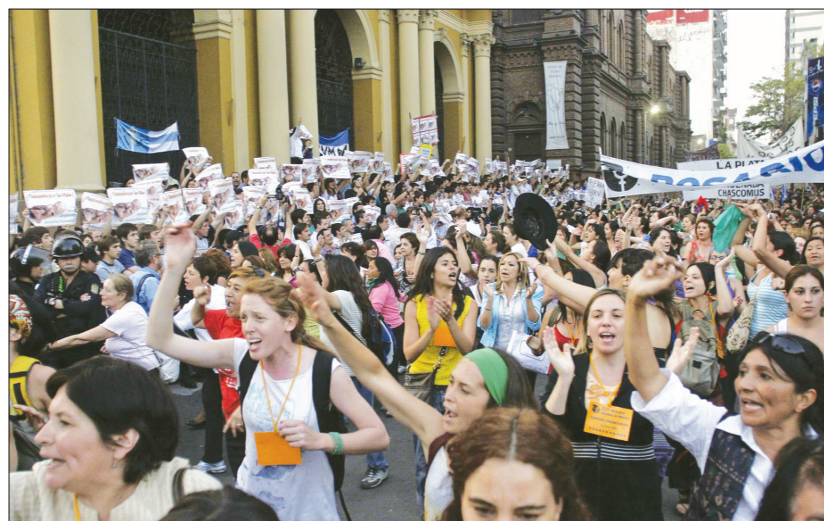
Ni las campanadas ni los rezos a grito pelado, ordenados por el obispo Villalba, alcanzaron para tapar las voces de Encuentro.

La Iglesia ataca al ENM Tal como advertíamos en el Boletín que el Plenario de Trabajadoras entregó de a miles a las mujeres en el Encuentro, “la Iglesia se preparó metódicamente para infiltrar el Encuentro” con miles de activistas clericales. El sábado, en el colegio La Merced, el arzobispo Luis Villalba ofició una misa “en la que estuvieron muchas de las 3.000 mujeres católicas que participan del Encuentro” ( La Gaceta , 11/10). Villalba “marcó el valor de la dignidad de