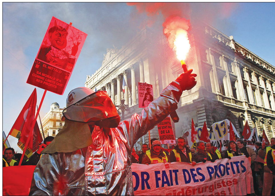
Movilización de los obreros siderúrgicos franceses durante la huelga de enero.

En Francia, Inglaterra y España, como en otros países, la ofensiva capitalista significó, antes que nada, el despido masivo de transitorios y precarios, pero comienza a golpear a una franja del proletariado estable y amenaza con el cie-