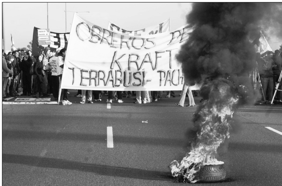
Piquete en la Panamericana. Las concesiones obtenidas en esta lucha han sido arrancadas por los piquetes y marchas heroicas de los compañeros y las organizaciones solidarias.

Mientras tanto, los despedidos aún siguen siendo 142, esto entre los primeros indemnizados y los 72 despedidos finales, aunque se ha dejado trascender que podrían haber más readmisiones. Los cinco delegados repuestos y el total de la Comisión Interna legal de planta, conformada por diez compañeros, son desconocidos como tales por parte de la