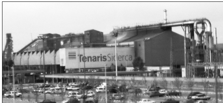
Planta de Tenaris Siderca. Se abre una ocasión para recuperar el nivel salarial y comenzar a discutir mejores condiciones de trabajo.