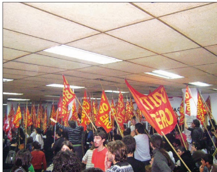
La UJS en el Congreso de la Fuba. La construcción de un movimiento de la juventud, en general, y el desarrollo de una organización socialista deben ir de la mano.

Para nosotros, la UJS, la organización de la juventud debe basarse en una estrategia política definida; o sea, un programa; de otro modo es inevitable la adaptación al régimen capitalista. Es lo que vimos con la izquierda sojera, el año pasado, y la izquierda audiovisual, recientemente, que coloca a la libertad de expresión bajo la tutela del Estado y de los monopolios capitalistas. La izquierda movimientista y basista caracteriza como progresivo el control de la actividad (contenedor) de los medios de comunicación por el Estado. Caracterizan al Estado bur-