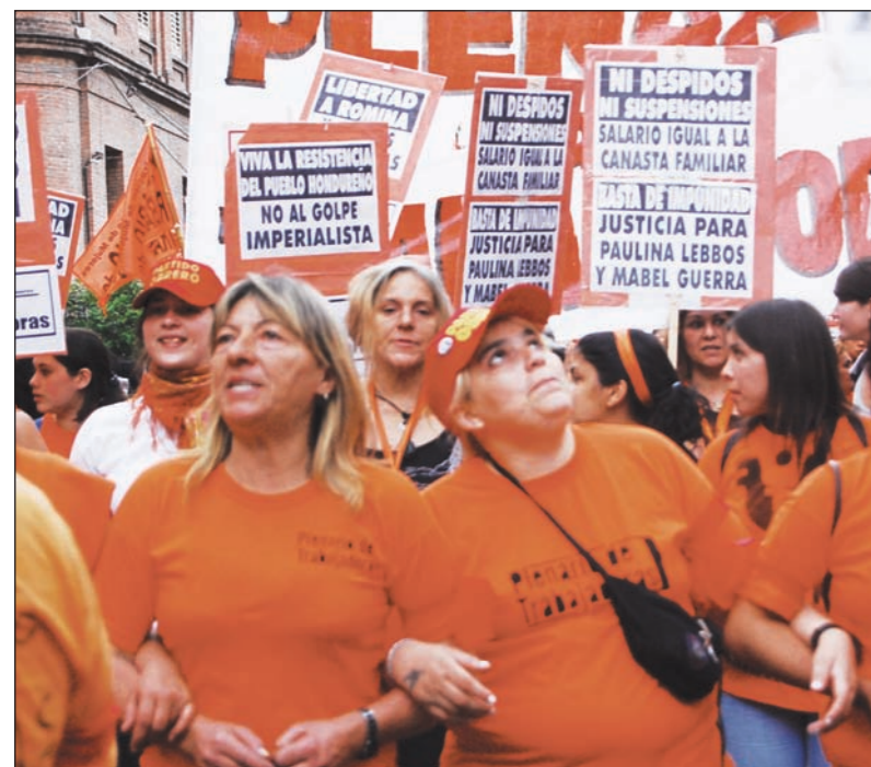
Un millar de luchadoras de todo el país integró la columna del Plenario de Trabajadoras.