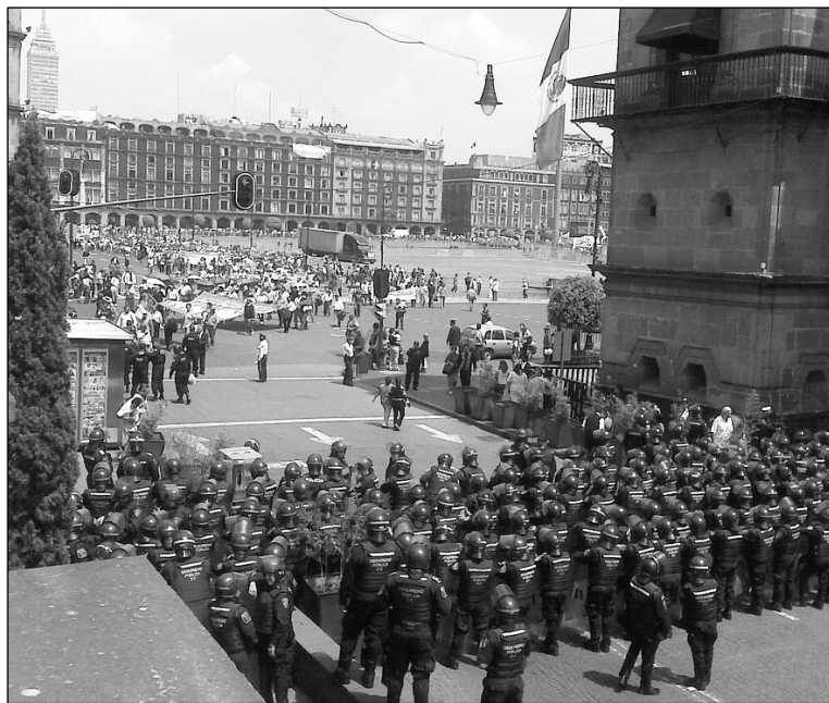
Movilización obrera contra la ocupación. Una operación militar en gran escala para impedir la resistencia a la privatización y la liquidación de las conquistas del convenio colectivo.

La ocupación militar tiene como objeto impedir cualquier resistencia al decreto de "extinción" de LFC, que el presidente Calderón firmó en la noche del sábado 10. Dos de los principales diarios mexicanos ( La Jornada y El Universal ) coinciden en denunciar que ese decreto es violatorio de la Constitución y de las atribuciones del Congreso. El objetivo de la "extinción" de LFC es "avanzar sustancialmente en el desmantelamiento y privatización de la industria eléctrica de propiedad de la nación" ( La Jornada , 12/10). Martín Esparza, del Sindicato Mexicano de Electricistas, denunció que "detrás de la liquidación de LFC se halla la intención de garantizar a particulares el usufructo de la red de fibra óptica del organismo" (ídem). Según La Jornada (12/10), la compañía fue sometida a "una política de abandono presupuestario (por) las recientes administraciones". La estatal CFE (generadora) le vende a LFC (distribuidora) a un precio igual al de cualquier industrial. Pero LCF está obligada a venderla al