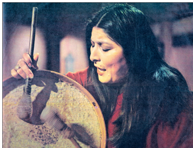
Mercedes Sosa en 1973. El legado de su obra artística perdurará en el imaginario social argentino.