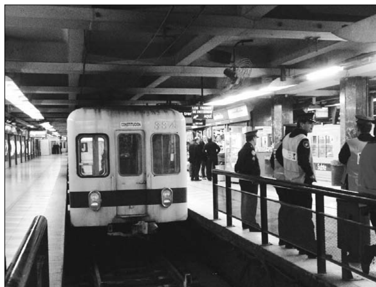
A pesar de la presencia policial, la huelga se garantizó con éxito

Resulta notable que una central que se reivindica alternativa y que pretende aglutinar a los nuevos sindicatos que surgen en la Argentina no intervenga en los