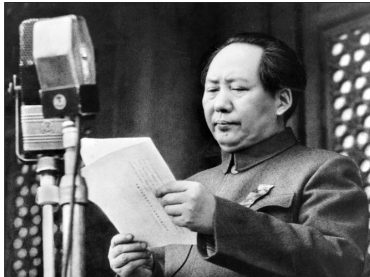
Mao Zedong proclama la República Popular China.

En China, el proletariado no ocupó de ningún modo el lugar que tuvo en la Revolución Rusa, porque había sido diezmado por la contrarrevolución primero y por la invasión japonesa después. El campesinado en armas quedó bajo la dirección del partido comunista, surgido al calor de la revolución de los años veinte. El papel