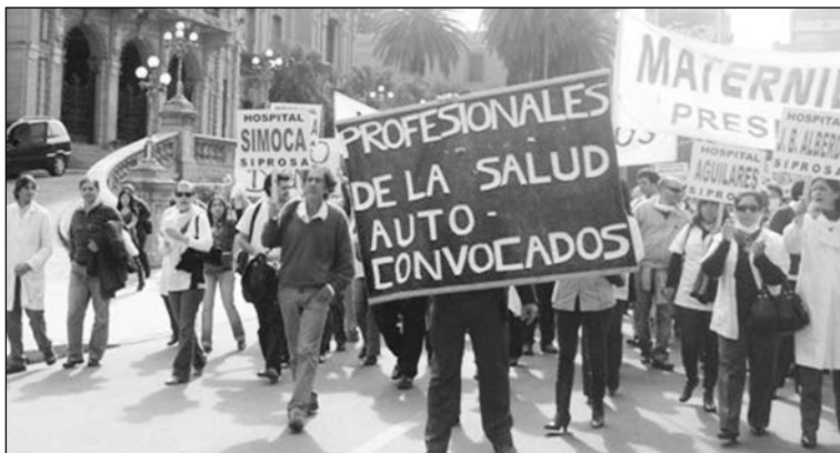
Autoconvocados de la Salud. El gobierno apuesta al desgaste, la lucha continúa.

Si el estado de ánimo general se reflejó en estas mociones, hay un bloque de delegados conciliadores que impulsan otra política: pasearse por Buenos Aires para recabar pronunciamientos de legisladores. Se le dio mucha pompa a una reunión que esta delegación tuvo en el Ministerio de Trabajo de la Nación, como si este ministerio fuera ajeno a las políticas de miseria salarial y precarización laboral. Este mismo bloque tiene como mediador a