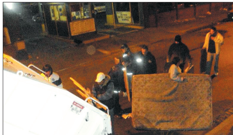
Patota en acción. La UCEP en el operativo en San Cristóbal.