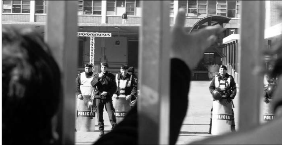
Kraft Terrabusi, militarizada. La capacidad de arbitraje del kirchnerismo está quebrada.

La lucha en General Pacheco mostró hasta qué punto está quebrada la capacidad de arbitraje del kirchnerismo. El gobierno no quiso, primero, llevar adelante los recursos de regimentación de las relaciones laborales establecidas por ley. Tomada por clausurada la conciliación obligatoria para que la patronal liquidara al activismo por la vía de los hechos. Pero la reacción solidaria a nivel nacional enfrentó el ataque de la empresa y obligó al gobierno y a todos sus alcahuetes (Moyano, Yasky) a operar un limitado cambio de frente. Esto le ha abierto un nuevo flanco de crisis política, que se irá profundizando, de un lado por los obstáculos que pondrá la patronal,