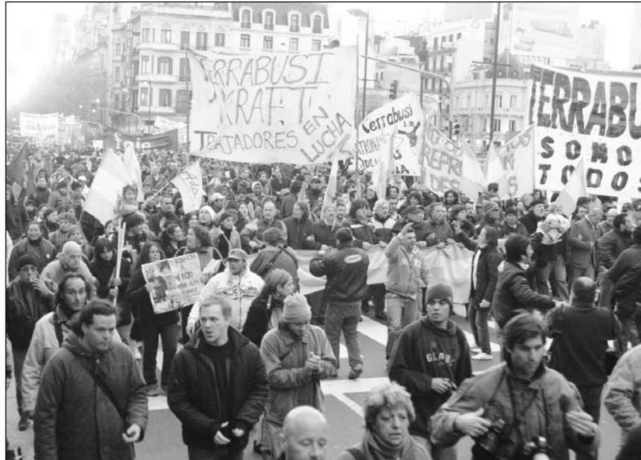
Lunes 28, masivo apoyo a los trabajadores de Kraft. Una profunda corriente de lucha en la clase obrera.

A pesar de ello, De Vido acaba de confirmar la reimplantación de ese tarifazo que debió suspender en julio. Quieren hacer correr los aumentos en medio de los menores consumos del