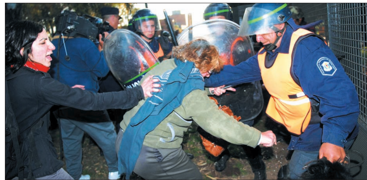
Represión. En el violento desalojo la policía hasta se robó parte del fondo de huelga.