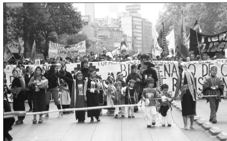
Movilización mapuche en Chile. En defensa de las libertades democráticas y de la tierra.