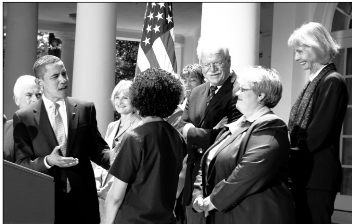
Reunión de Obama con parlamentarios demócratas, la crisis política sigue abierta. La reforma traerá más ajustes sobre los beneficiarios de planes federales

Las aseguradoras quieren mantener su altísima rentabilidad, amenazada por la crisis: 17.000 personas por día pierden el empleo y la cobertura. Los patrones contratan primas más baratas o directamente las anulan. Como las primas aumentaron cinco veces más que los salarios en los últimos años, hay trabajadores que no pueden pagar su parte. Una opción pública obligaría a las compañías de seguro a bajar las primas para no perder parte de su clientela privada y empresarial. Aunque los 170 medicamentos considerados esenciales cuestan en Estados Unidos 80%