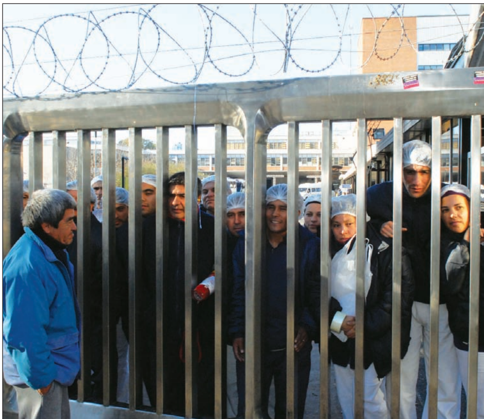
Los obreros de Terrabusi, en lucha

Terrabusi, el subte, petroleros. El gobierno, que muestra su mejor sonrisa ante el FMI, rechina los dientes contra la clase obrera.