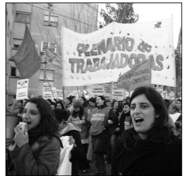
Movilización del Plenario de Trabajadoras. El Encuentro de Tucumán es una gran oportunidad para poner en pie un movimiento nacional de mujeres.

El próximo Encuentro se desarrollará en una coyuntura política atravesada por la aguerrida lucha de la salud en Tucumán, por el crecimiento de la resistencia a la profundización de las po-