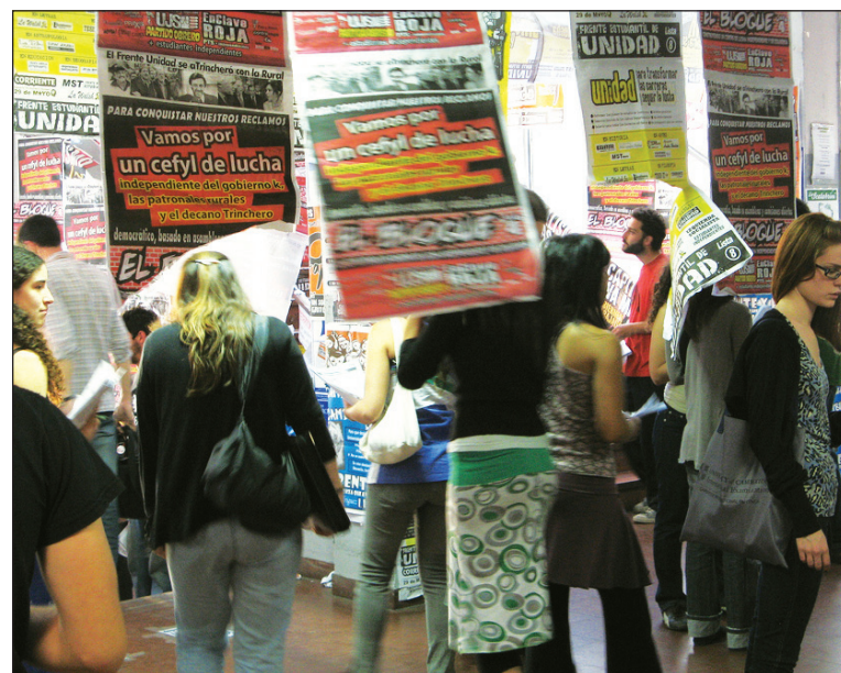
La UJS en campaña. Frente al fracaso de los 'progres', defender la independencia política del movimiento estudiantil y su unidad con los trabajadores.

De todas las fuerzas políticas actantes en la UBA, la UJS-PO es la única que se presenta en todas las facultades. Hemos organizado frentes únicos para enfrentar a la Franja Morada y a los K, con