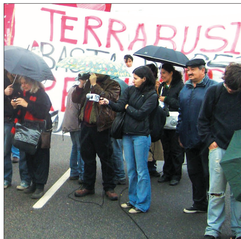
Movilización y corte de los trabajadores de Terrabusi en la Panamericana.

En este cuadro, la voluntad de lucha de los compañeros sigue firme y la solidaridad del conjunto de la planta para con los despedidos es emocionante. Los trabajadores son conscientes de que si pasa esta golpe se vienen más despedidos, porque la patronal quiere liquidar un turno, imponer las 12 horas y el turno americano, terminar con