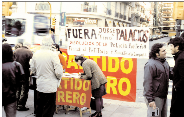
Mesa de agitación del Partido Obrero. La campaña es popular en los barrios y entre los trabajadores.

La otra punta del operativo de puesta en marcha de la nueva policía es el acuerdo con el gobierno nacional y con la Policía Federal. Para esto se armó una comisión entre el ministerio de Seguridad y Justicia de la Nación (Alak) y el de la Ciudad (Montenegro), integrando a la cúpula de la Federal y a Palacios. Mientras los "K" cacarean en la Legislatura contra Palacios,