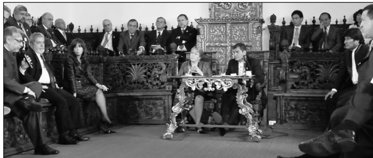
Conferencia del Unasur, un complot contra las masas de América Latina. Iniciemos una campaña para realizar en Honduras un congreso popular internacional

Pero si de bufonería se trata, la copa del mundo se la lleva la Unasur. Los presidentes de los países que la integran desfilaron por Quito sin hacer avanzar un ápice la causa contra el golpe hondureño — y tampoco contra las bases colombianas. Aquí también está en marcha un 'arreglo': Brasil 'exigió' a Estados Unidos que las bases no fueran usadas más allá de las fronteras colombianas. Lula sabe que se trata de una estupidez, pues el radio de acción que permite la aviación que opera en ella excede largamente el territorio colombiano. Pero al 'metalúrgico' brasileño sólo le importa salvar la cara y obtener, a cambio, una mayor cantidad de contratos para su empresa aérea Embraer y para otros proyectos militares. En nuestras pisoteadas tierras, los nacionalistas presentan estos hechos como una ocasión para justificar un mayor gasto militar, que para ellos sería 'antiimperialista'. Incluso presentan como tal a la integración militar que promueve Unasur. Nada más falso: las débiles economías de América Latina y sus clases trabajadoras no tienen espaldas para soportar el gasto en armamentos. La vía del 'antiimperialismo' es el desarrollo de la revolución a lo largo y ancho del continente —no pasa de ningún modo por alimentar es-