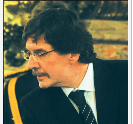
Alberto Sileoni, nuevo ministro de Educación

El kirchnerismo apela ahora a un ex menemista con muy buena relación con la burocracia sindical para tratar de armar una suerte de Consejo Económico y Social de la educación.