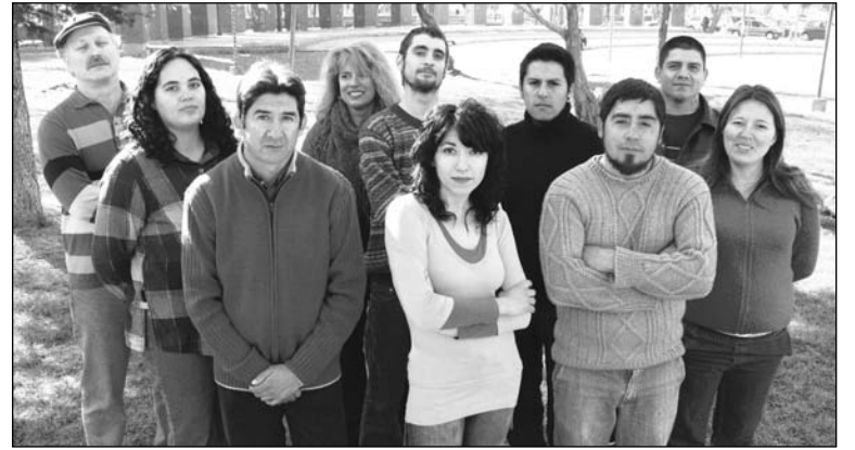
Neuquén, los candidatos del Partido Obrero. Organizarse para luchar de manera independiente.