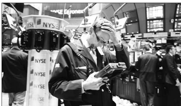
Corredor de la bolsa de Wall Street. La fuente principal de los mayores beneficios ha sido una mayor tasa de explotación de la fuerza de trabajo, pero no está dicha siquiera la penúltima palabra.

laboral acompañada por una reducción mayor de los sueldos. La cifra oficial de desempleo en Estados Unidos es de 9,5% de la población activa, unos veinte millones de trabajadores, pero cuando se añade a las personas que han dejado de buscar trabajo, a las que están obligadas a trabajar menos (6%) y a la población carcelaria - el porcentaje se eleva a los veinte puntos, o sea a cuarenta millones de desempleados. Recientemente, las cámaras empresariales rechazaron la decisión de los estados de elevar el salario mínimo de 5,25 a 7,0 dólares la hora, con el argumento de que no podrían soportar ese mayor costo. Otro elemento fundamental es el recorte en los aportes patronales a la cobertura de salud, que forma parte del llamado 'costo laboral'; el número de personas sin protección médica ha crecido en forma impresionante. Un ejemplo brutal de la reducción del precio de la fuerza de trabajo se observa en el caso de la industria automotriz, donde los salarios fueron recortados un 70% y la cobertura de salud en cerca de la mitad. Como ocurriera en la primera fase de la crisis del '30, los trabajadores no han opuesto una resistencia significativa a este desplome, sorprendidos por la magni-