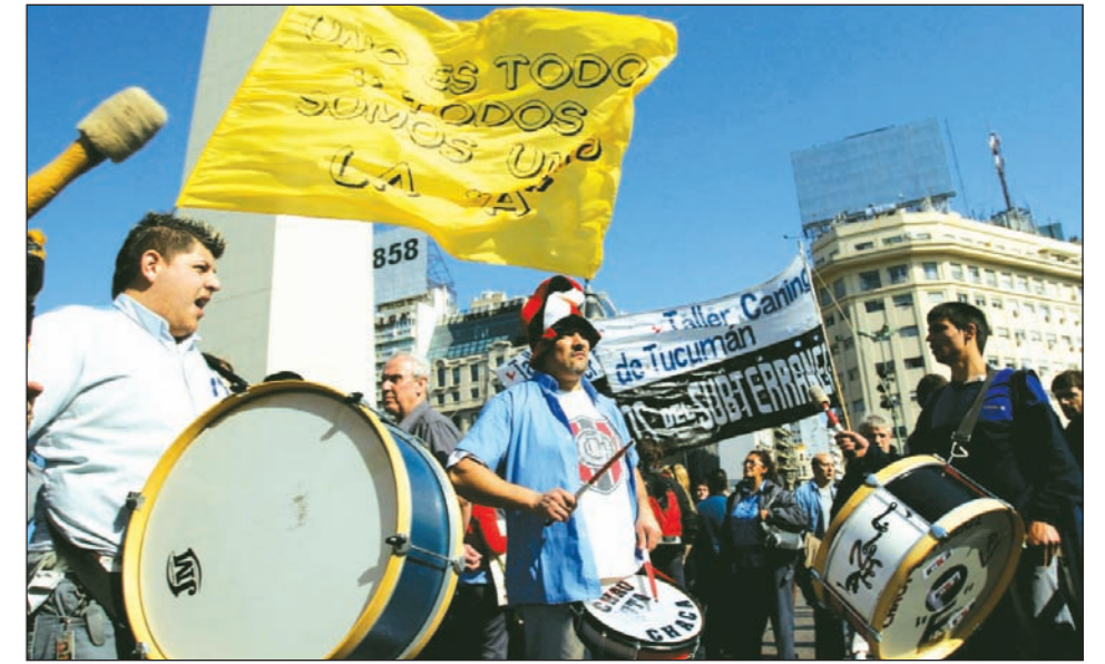
La mayor movilización de la historia del subte. Por el reconocimiento del sindicato y el aumento salarial.

El gobierno también está jugado a la UTA, como lo prueba que jamás salió la simple inscripción del sindicato más representativo y numeroso de todas las nuevas organizaciones del movimiento obrero.