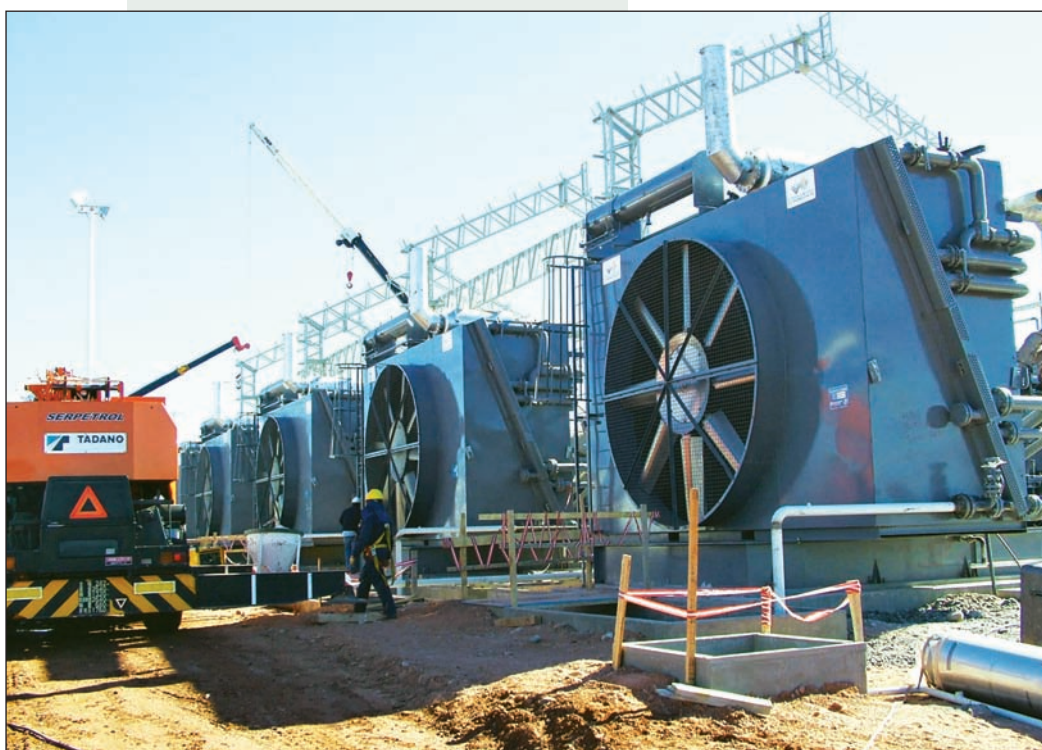
Yacimiento de Loma la Lata, Neuquén. El precio del gas debe estar de acuerdo con el costo de producirlo; para ello, hay que cortar por lo sano.

Las tarifas del gas han subido un 400 por ciento. ¿Por qué? Una, para engordar a las petroleras, que reclaman el precio internacional. La otra, para engordar a De Vido, que maneja el 'cargo fijo' que financia los fondos que importan gas a ese precio internacional. El precio del gas debe estar de acuerdo con el costo de producirlo, no con la ganancia rentística de los pulpos internacionales.