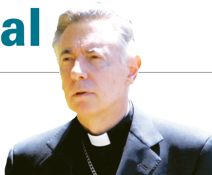
Obispo Héctor Aguer

Los docentes y los alumnos, a través del debate franco y democrático, son los que pueden convertir el mamarracho conciliador pergeñado por curas y funcionarios en una herramienta útil para la prevención del embarazo adolescente, de las enfermedades de transmisión sexual y para construir vínculos más solidarios y fraternales entre los dos sexos. La denuncia del avance del oscurantismo clerical en la educación, y de la adaptación del gobierno al clero, son buen punto de partida para impugnar todas las otras opresiones que impone este régimen social a la juventud y a todos los explotados, en la cama y en todas partes.