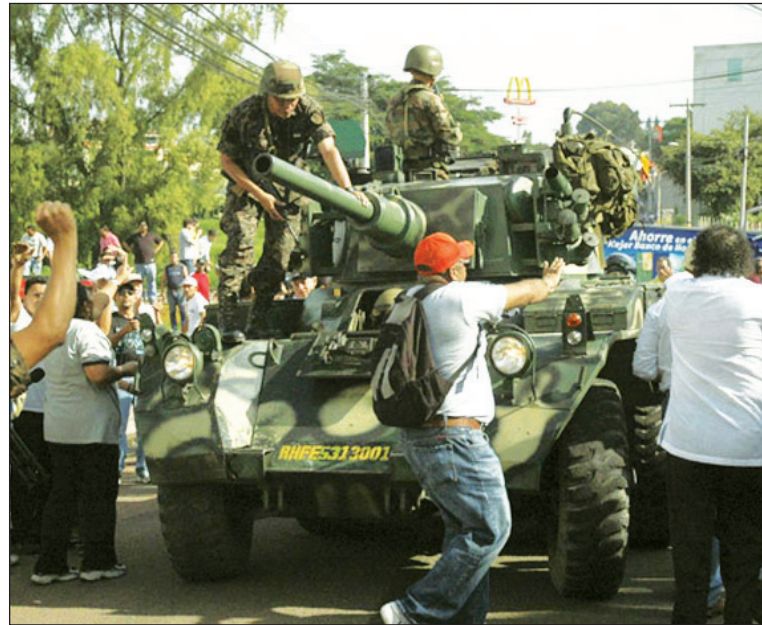
El pueblo de Honduras continúa resistiendo.. Asistimos a una puja interimperialista, la lucha contra el golpe hondureño y contra las provocaciones del imperialismo exige un planteamiento de conjunto.

analistas sostienen que la ampliación de la presencia militar yanqui en Colombia atentaría contra la seguridad de la Amazonía. En ese caso, sería un excelente pretexto para reforzar la militarización que ya se encuentra en curso en Brasil. Más adelante, quizá con otro gobierno, todo podría terminar con una alianza militar entre Estados Unidos y Brasil. Pero llama la atención que el canciller brasileño asociara el tema de las nuevas bases militares con la negociación comercial de Doha (donde Brasil pelea por una fuerte rebaja de los aranceles que perjudican sus exportaciones) y con los altos impuestos que le exige Estados Unidos para vender en ese país el etanol —el biocombustible que deriva de la caña de azúcar. Con esto tenemos otra pieza más en la puja y en la negociación desatada por el golpe en Honduras. Los fac-