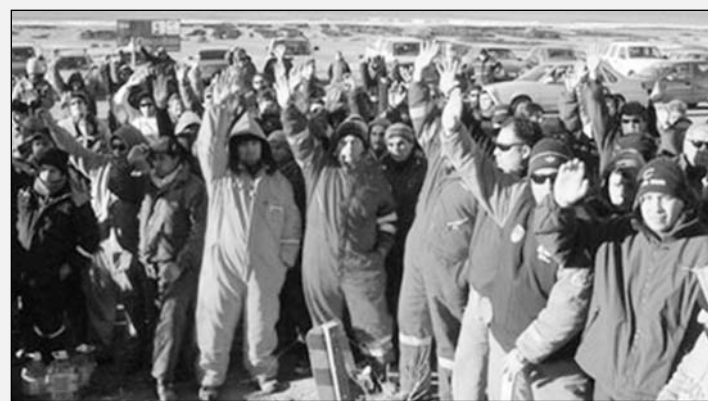
Asamblea de petroleros en Las Heras