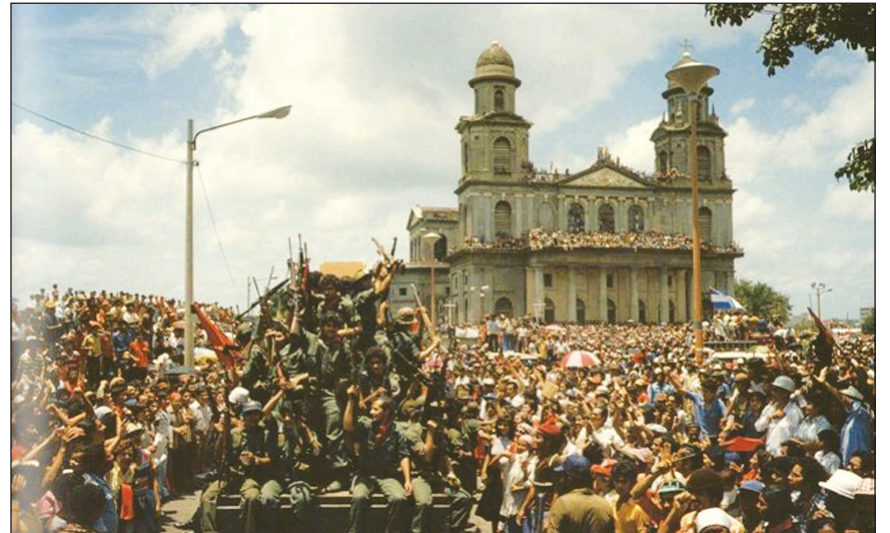
Hace treinta años, los sandinistas entran en Managua.

Sobre esas bases, ¿podía triunfar la revolución, dándole una solución radical al atraso del país y a la opresión nacional de las masas nicaragüenses? "Es indudable que no. La más elemental reivindicación de las masas —la extirpación de raíz de la dictadura somocista, la satisfacción de la aspiración a la tierra de las masas campesinas, y la completa y cabal independencia del país— exige, mínimamente, la confiscación de la gran propiedad agraria y del somocismo, la recuperación para la nación del control de sus recursos estratégicos y el armamento de los obreros y campesinos. La realización de este programa democrático revolucionario choca de inmediato con la propia burguesía democratizante, ligada al gran latifundio, al capital extranjero y durante 40 años defendida por la Guardia Nacional. La estrategia burguesa democratizante formulada por el FSLN y sus aliados de la Junta de Reconstrucción Nacional 3 no es otra cosa que una soga atada al cuello de la revolución y de las masas insurgentes. Sólo la conquista del poder por el proletariado, apo-