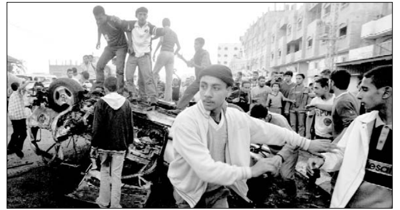
Gaza, una masacre premeditada. "La idea era dejar un área estéril cuando nos marcháramos"

Una de las denuncias más impactantes del informe es la referida a la utilización sistemática de civiles palestinos, incluso niños, como