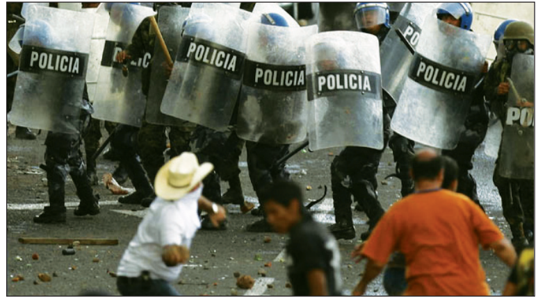
Se inicia una huelga general en Honduras. Para Obama no es una cruzada por la democracia, sino de una dura pelea para realinear el proceso latinoamericano.

Hay que pasar a los bifés. Si Zelaya y los gobiernos que lo apoyan no quieren pasar a la historia como bufones, hay que largar el regreso del terrateniente venido a amigo del pueblo. Zelaya debe in-