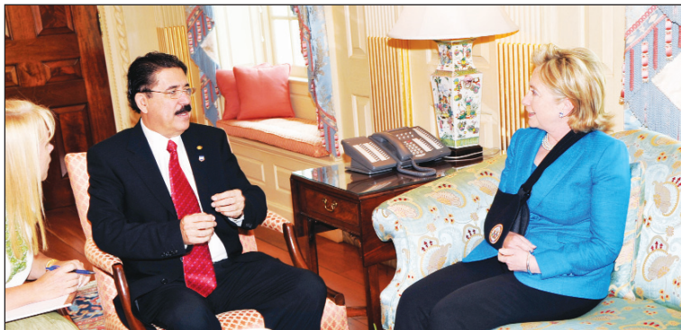
Manuel Zelaya y Hillary Clinton. Obama ha hecho de Honduras un aspecto de un paquete más grande

recha a la diplomacia de Washington en América Latina. Quienes rescataron el nuevo rol de la OEA, luego de que derogara por unanimidad la disposición que excluyó a Cuba, han sido desmentidos en tiempo record. El imperialismo no se identifica solamente con la táctica del 'garrote', sino también con la del 'guante de terciopelo'.