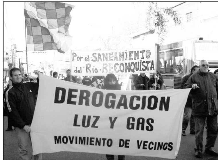
Movilización contra el tarifazo del verano pasado. Los aumentos afectan a toda la población, especialmente a los trabajadores y a la clase media.

Y sobre este tarifazo del gas, el gobierno mantiene un progra-