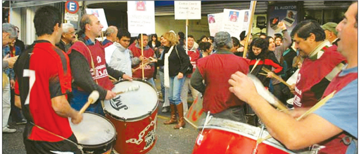
La acción de los trabajadores frustró el cierre de la planta. Ahora se abre una nueva etapa.