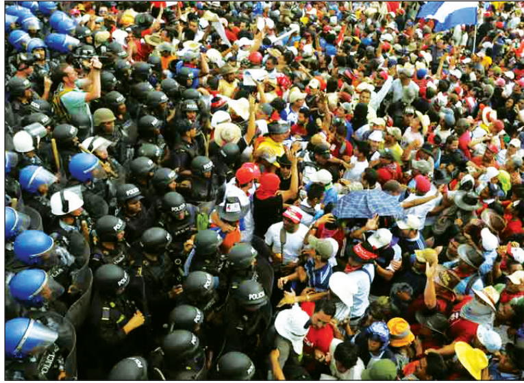
Los asesinatos han aumentado la resistencia popular al golpe

Ahora aparecen legisladores del Partido Liberal, al cual pertenecía Zelaya, que denuncian “que