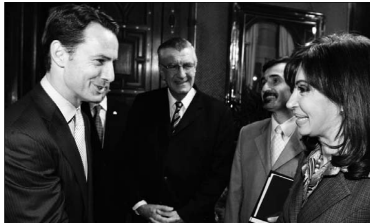
Directivos de la Barrick con Cristina Kirchner. Sus tentáculos se extienden hasta la Rosada.