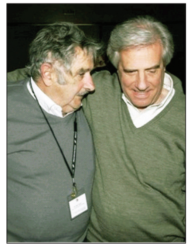
Pepe Mujica y Tabaré Vázquez

La crisis en el FA late en el descontento que muestra inclusive la propia prensa frenteamplista sobre la gestión oficial. El FA en el gobierno ha sido una muestra emblemática del transfuguis-