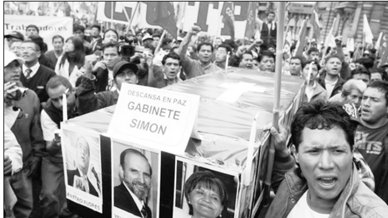
Movilización obrera y campesina. Un nuevo pico en la lucha del pueblo peruano

“Diversas localidades peruanas han estado minadas de protestas en las últimas semanas, donde nativos y campesinos han salido a las calles a manifestar para que sus necesidades sean escuchadas” ( idem ). Ese grado de movilización ha obligado a la burocracia de la CGTP a consumir