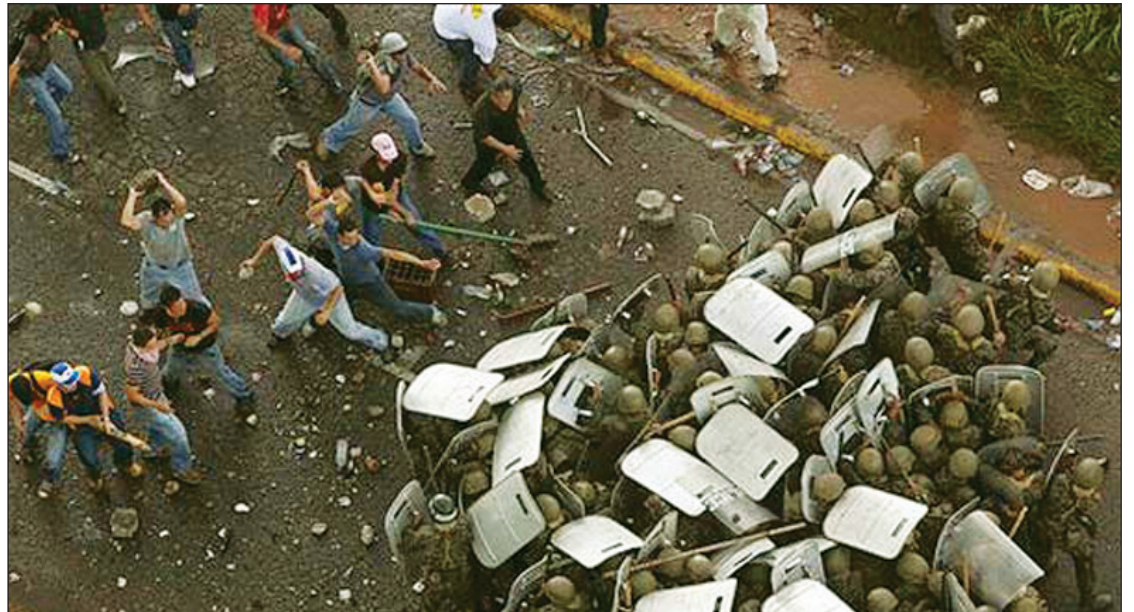
Las maniobras diplomáticas tienen como objetivo neutralizar la posibilidad de un levantamiento popular.

Las maniobras diplomáticas se despliegan con una fanfarria sospechosa, que recuerdan el fiasco en el que concluyó la convocatoria a varios Presidentes, a fines de 2007, para recibir en la selva colombiana a la secuestrada Betancourt. El objetivo de ellas es neutralizar la posibilidad de un levantamiento popular en Honduras, con la zanahoria de una salida ‘más económica’, de origen internacional, y también los ajetreos diplomáticos de Chávez y de los mandatarios del Alba. Pero es claro que el golpe tiene un fuerte apoyo de toda la gran burguesía en Centroamérica y más allá de ella en toda América Latina —porque responde al propósito fundamental de la burguesía internacional de aprovechar la crisis mundial para revertir los procesos ‘bolivarianos’ en su conjunto. Es obvio que se trata de un operativo delicado, que parte de una apreciación dividida