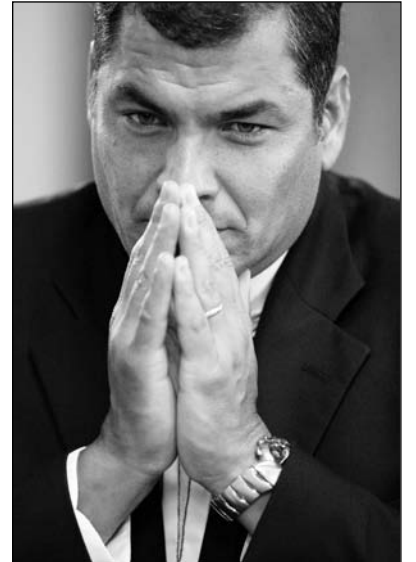
Rafael Correa, presidente de Ecuador. O aplica un ajuste fiscal riguroso o va a un nuevo default.