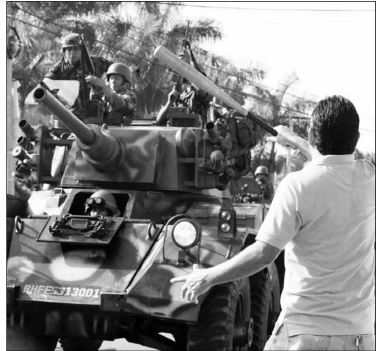
El pueblo salió a enfrentar la asonada militar.

El gobierno reunió 400 mil firmas que permitieron convocar a ese plebiscito no vinculante para incluir o no, en las elecciones de noviembre, una "cuarta urna" con la finalidad de elegir una Asamblea Constituyente que reformara la actual Constitución, vigente desde 1982. El plebiscito debía hacerse el domingo 28, pero el ejército se negó a distribuir