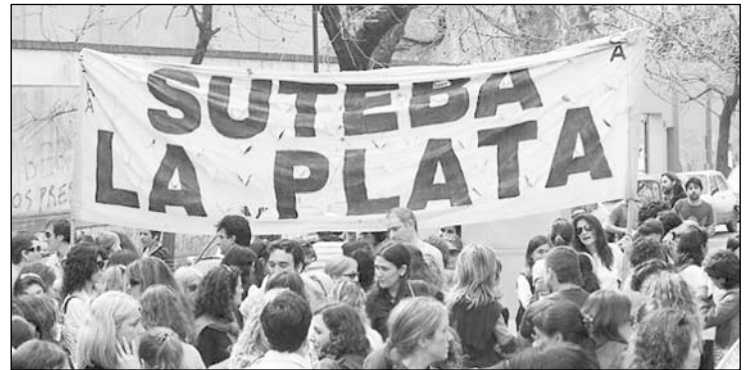
Martes 23 de junio. Cientos de compañeros se movilizan para defender su sindicato.

rrón. Cientos de docentes plantenses se movilizaron para defender su sindicato y con ellos compañeros de todos los distritos del conurbano, de los sutebas de General Sarmiento, Lomas de Zamora, Escobar, Matanza, Ensenada, Merlo, Esteban Echeverría-Ezeiza, Varela, etc. Junto a la docencia bonaerense, estuvieron presentes innumerables organizaciones de lucha de los trabajadores, como delegaciones del Subte, de la Conadu H, de la Fuba, del Astillero, del Indec, de Ioma, de ATE-Educación, con todos los cuales se resolvió salir con una gran campaña nacional e inter-