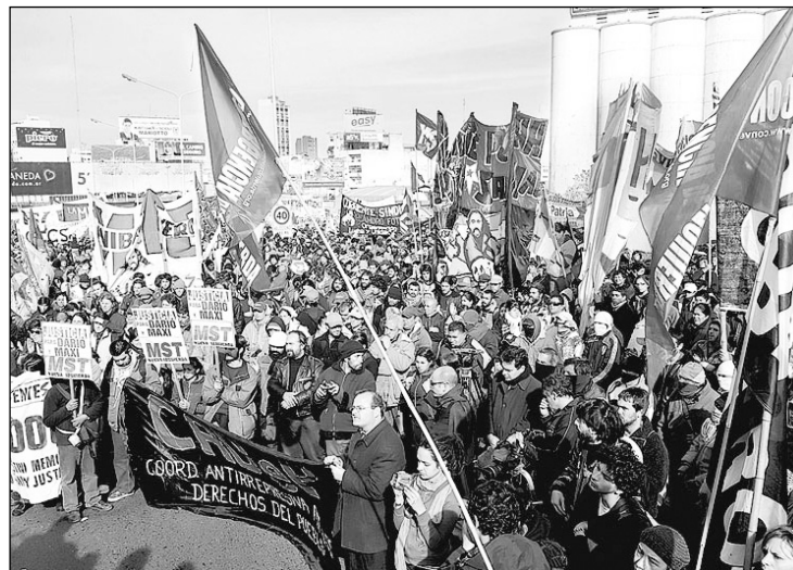
A siete años. Reclamamos el castigo a los responsables políticos de la represión