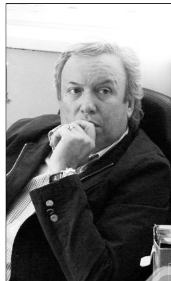
Daniel Peralta, gobernador de Santa Cruz. Las elecciones reflejaron de manera retardada la la lucha de 2007.

Para los trabajadores se replantea el tema de salir a reclamar el aumento salarial, la