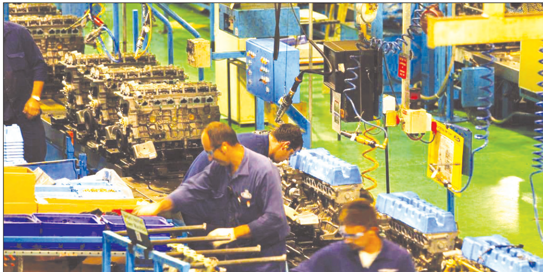
Línea de montaje de Chrysler.

¿Cómo es, entonces, que una compañía potencialmente en quiebra puede salir al rescate de otras efectivamente quebradas? Precisamente, ese rescate no existe: Fiat no aporta ni un solo euro de capital —sea a Chrysler o, eventualmente, a la sucursal de GM en Alemania, Opel o a GM misma. La plata del rescate la ponen, en primer lugar, los obreros norteamericanos, que han sido forzados a capitalizar sus fondos de salud y a admitir una reducción brutal de sus salarios. En segundo lugar, se deberán poner los acreedores financieros, para los que se prevé una quita que puede llegar al 75% de sus derechos. El principal rescatista es, sin embargo, el Estado norteamericano, o sea los contribuyentes, que ya han