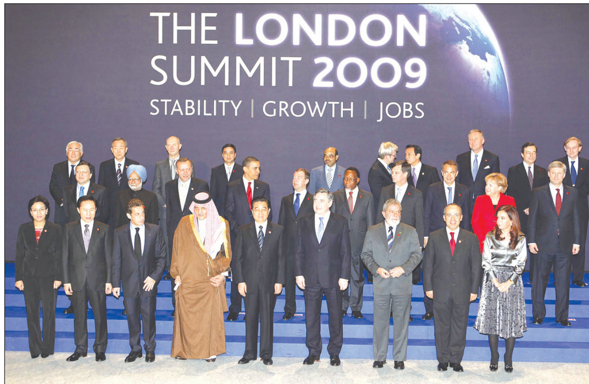
G20 en Londres: "encaminar la bancarota capitalista mundial, ante la imposibilidad obvia de superarla".

En realidad, esta presentación del problema sólo sirvió al propósito de disimular que el G-20 no tiene las condiciones ni tampoco es el ámbito para tratar el núcleo duro de la crisis: varios billones (millones de millones) de activos y de préstamos invendibles y, por lo tanto, completamente desvalorizados, que los bancos de todas las latitudes — pero especialmente los norteamericanos — tienen en su poder. Estos activos sin valor impiden a los bancos hacer frente a las deudas que han contraído por valores similares. A la larga esto conduce a la quiebra del sistema financiero internacional y al desplazamiento monetario. La caída brutal de la demanda mundial no es la causa