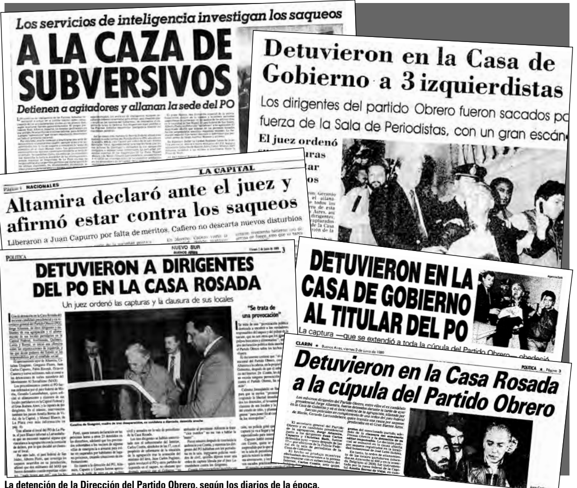
La detención de la Dirección del Partido Obrero, según los diarios de la época.

No siempre Alfonsín había exigido el retiro de los militares. En marzo de 1980, cuando el ministro del Interior de la dictadura, el general Albano Harguindeguy, comenzó su ronda de "diálogo político" con vista a una apertura electoral, Alfonsín estuvo entre sus interlocutores (un