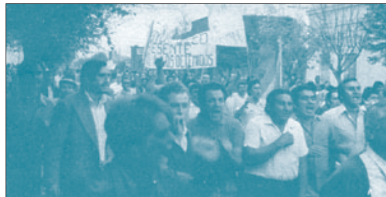
Movilización en Villa Constitución (Arr.) Acindar ocupada (Ab.)

Esa misma tarde, una asamblea masiva decidió el paro y no sólo el paro: "La extraordinaria ocupación de fábrica de Acindar... se extendió a Marathon, a Metcon, y la huelga general abrazó no sólo al conjunto del proletariado de la zona sino a la totalidad de la población... la huelga se ha extendido a poblaciones vecinas, donde viven obreros de Acindar. Las asambleas en la fábrica ocupada se realizan con la participación de los familiares de los trabajadores... se