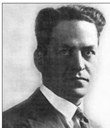
Raúl Scalabrini Ortiz y Arturo Jauretche.

Por eso, Jauretche rechazaba con énfasis hasta la idea de la lucha de clases dentro del país, todo en nombre del conflicto entre esa oligarquía y los “intereses nacionales”. Por eso, decía él, “todos los sectores sociales deben estar unidos verticalmen-