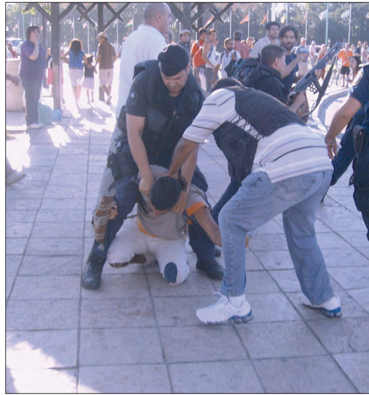
Tigre: sábado 28 de febrero. Represión contra los artistas callejeros.

La represión del 28 de febrero pasado no es grave sólo por lo que pasó, sino también por lo que preludia. El mensaje de la intención es claro: No vamos a dejar que se manifiesten. No vamos a dejar que el Tigre del turismo, de los countries y los barrios ce-