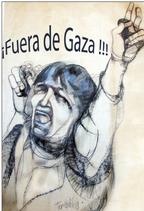
ILUSTRACIÓN: CARLOS TERRIBILI

La designación de Mitchell despierta inquietud en Israel. Se teme que reclame el congelamiento de los asentamientos israelíes en Cisjordania, como lo hizo en 2001 en una misión similar. Esos asentamientos están contruidos en tierras robadas a los palestinos; lo acaba de confirmar un informe del propio Ministerio de Defensa, ocultado por el gobierno y revelado recientemente por el diario israelí Haaretz . Según el informe, "30 colonias se ampliaron sobre las fincas ro-