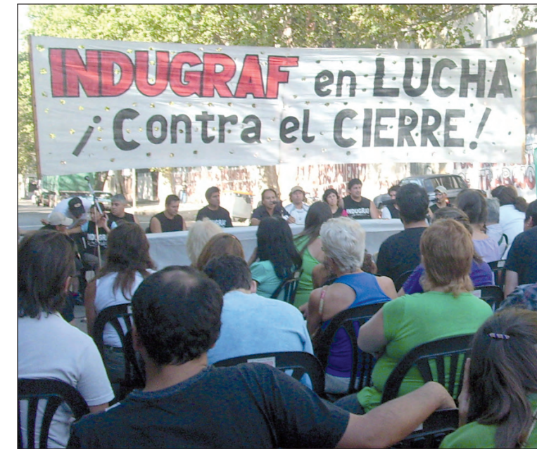
Sábado 31, delibera el plenario convocado por Indugraf.