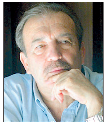
Claudio Lozano, Cristina Kirchner, Patricio Etcheagaray.

respaldo político a la ocupación israelí de los territorios palestinos. Israel domina y desorganiza la vida económica de los territorios ocupados, que a todos los efectos prácticos son simples extensiones del “espacio económico” israelí. Esto vale para Gaza cercada y también para Cisjordania. Los territorios palestinos no tienen moneda propia: se valen del shekel israelí, que en última instancia sólo puede ser gastado en Israel. La Presidenta se apresuró a promulgar un acuerdo secreto y militarista con un Estado que impulsa la ‘limpieza étnica’ de los árabes de Palestina.