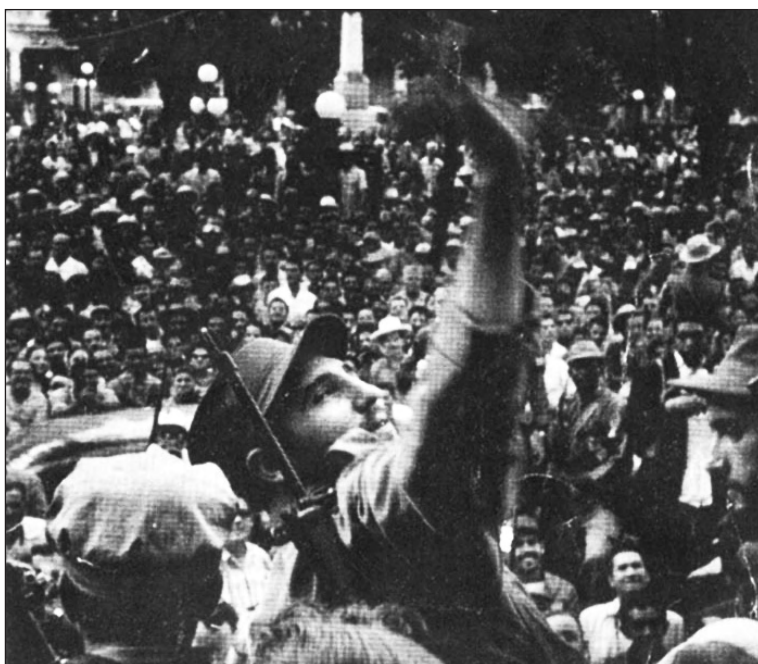
Fidel Castro entra en Santiago de Cuba.

Con la excepción de los que se libraron en Santo Domingo y Santa Clara, los combates fueron relativamente pequeños. También, relativamente, las bajas que sufrió el MR26: 40 bajas durante la ofensiva de Batista contra la Sierra Maestra; seis en Santa Clara. El MR26 sufrió sus mayores bajas en las ciudades —no en la Sierra—, como consecuencia de las desapariciones y asesinatos de la policía batistiana.