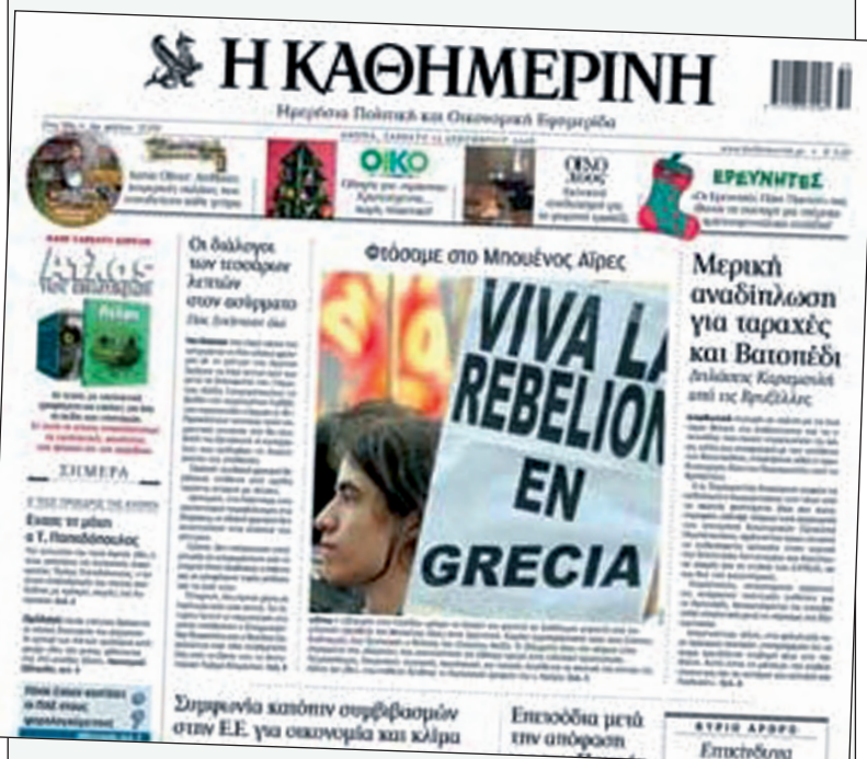
La portada del diario griego "Kathimerini" muestra una foto de la movilización de la Fuba a la Embajada de Grecia en Buenos Aires, realizada el 11 de diciembre.