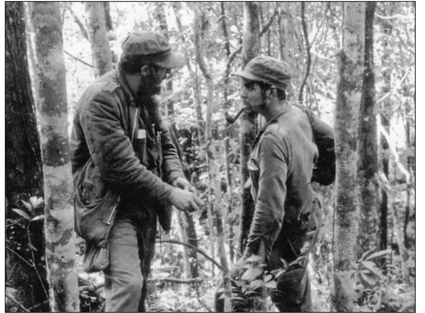
Fidel Castro y Ernesto Guevara en la Sierra Maestra.

El 9 de abril de 1958, el Movimiento Revolucionario 26 de Julio lanzó una huelga general revolucionaria para derrocar a Batista. La huelga fracasó; Batista lanzó entonces una enorme ofensiva militar contra la Sierra Maestra para aplastar al MR26.