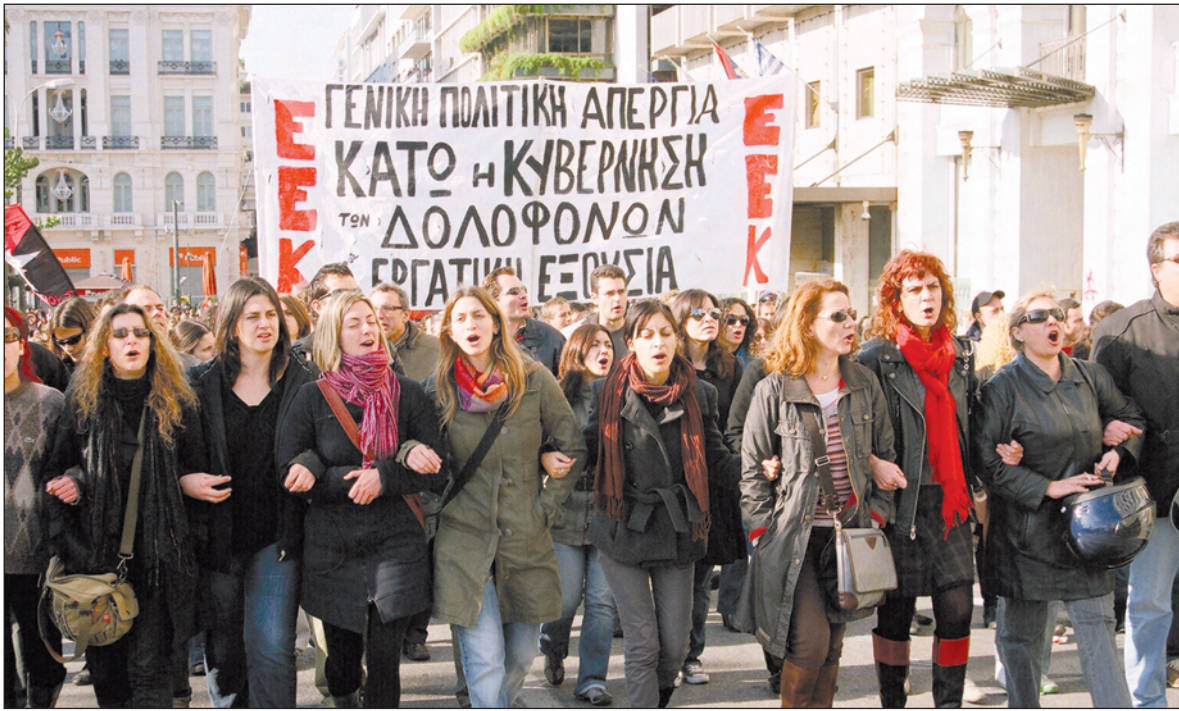
Columna del EEK (Partido Revolucionario de los Trabajadores) marchando en Atenas durante la jornada de la huelga general.