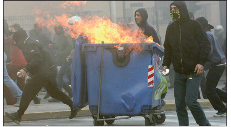
La movilización no cede. A pesar de la represión: Un policía dispara un arma de fuego sobre la multitud.

La oposición oficial, el seudo socialista Pasok, condena los motines, y sus miembros en la dirección de la Confederación General del Trabajo (GSEE, su la sigla en griego) votaron junto con la derecha cancelar la marcha convocada en Atenas para el miércoles 10, cuando está prevista una huelga general de 24 horas.