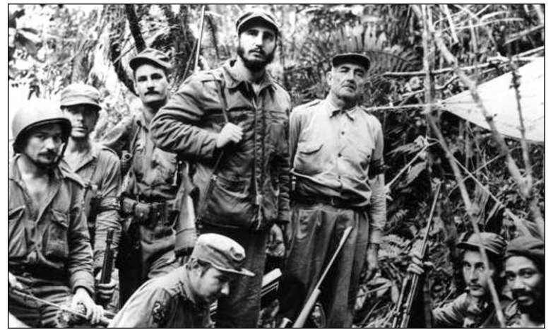
Junio de 1957. Parte de la dirección del MR26 en Sierra Maestra. Fidel Castro (al centro), Raúl Castro (en cuclillas), Ernesto Che Guevara (en segundo plano, a la izquierda).

Las direcciones urbanas del MR26 plantearon que había llegado el momento de convocar a la huelga general que derrocaría