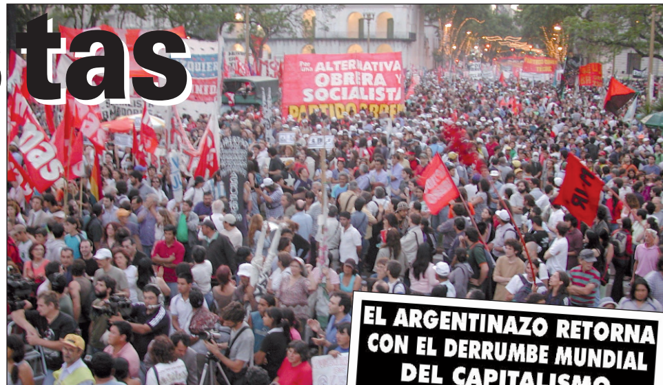
20 de diciembre de 2005. Movilización en el cuarto aniversario del Argentinazo.

La propuesta es una marcha a las 17 horas, desde Congreso, y un acto en Plaza de Mayo, de carácter unitario, con documento único, con destaque en el palco de los cuerpos de delegados y representaciones de trabajadores en lucha, invitando especialmente a las fábricas mecánicas en lucha, subtes, etc. También del resto de organizaciones piqueteras, estudiantiles, de derechos humanos, populares y políticas como en años anteriores. Las consignas acordadas constituyen una base para el llamado a otras organizaciones y para la redacción del documento común. La comisión redactora del documento tendrá su primera reunión el jueves 11/12 y el próximo