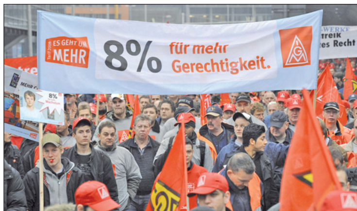
En Alemania los metalúrgicos también se movilizan.

zi, la principal del país, manifiestan contra los despidos frente a la sede del gobierno.