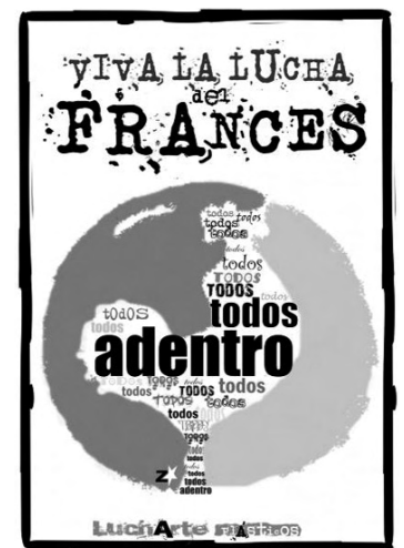
Colaboración del grupo de artistas plásticos de LuchArte.

El gobierno quiere sacarse de encima a 100 activistas y despedir a 60 compañeros (entre ellos la totalidad de la interna), pero quiere, claro, quedarse con el MST. El MST fue cuidadosamente conservado por Ocaña para que colabore con el nefasto papel de descabezar a la interna junto