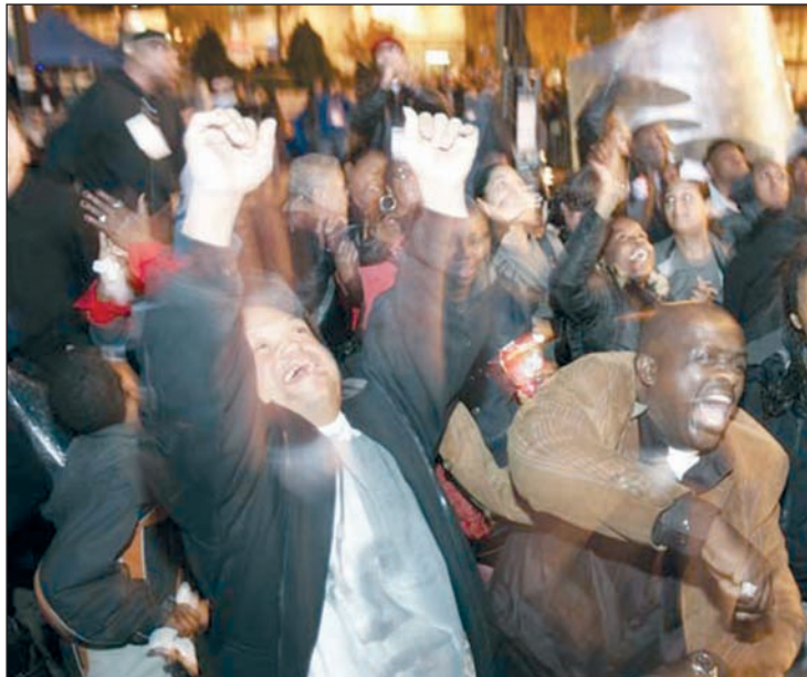
Festejo de partidarios de Obama al conocerse el resultado.

Obama ganó en la inmensa mayoría de las ciudades importantes, incluidas las capitales de los estados donde ganaron los republicanos: en Texas (el estado de Bush) ganó en Dallas, Houston, San Antonio, El Paso y Austin, las cinco ciudades relevantes; en Arizona (el estado de McCain) ganó en Tucson. Ganó también el voto hispano, lo que le dio la victoria en Florida y en la mayoría de los condados que limitan con México, tanto en los estados ganados por los demócratas (California, y Nuevo México) como en los ganados por los republicanos (Texas y Arizona). Arra-