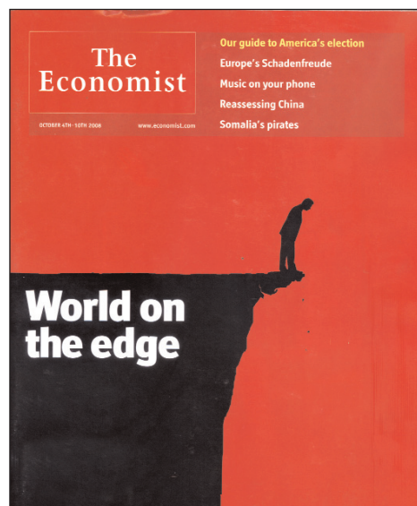
"El mundo sobre el abismo". Tapa de la última edición de The Economist

En el cargador quedan apenas una o dos balas: la nacionalización consentida o impuesta del conjunto del sistema bancario.