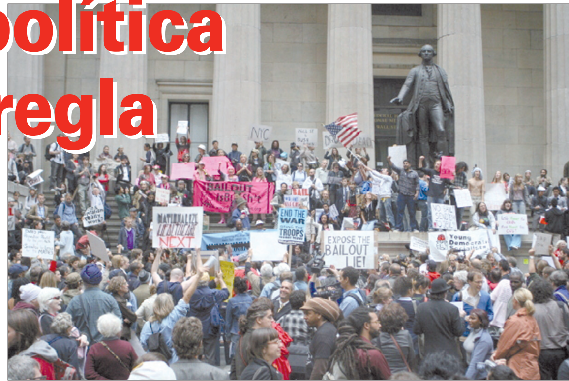
Contra el salvataje bancario. Han comenzado las movilizaciones populares.

Por lo que se sabe, el plan que se pondrá a votación en el Senado, el miércoles 1º por la noche, es apenas una variante del que fue rechazado. Los planteos alternativos no lograron consenso; uno establecía rescatar a los bancos mediante una participación estatal en su capital, lo cual