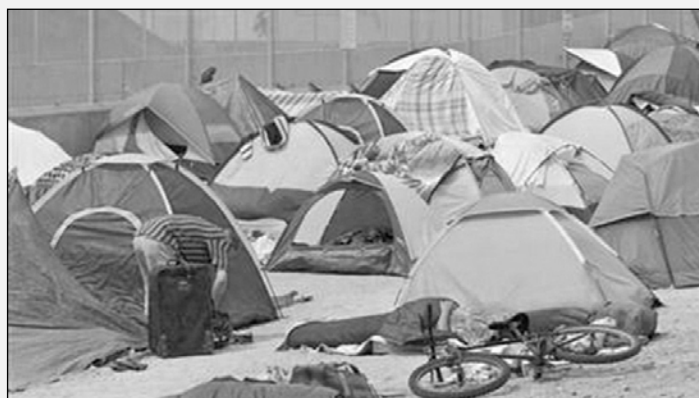
Campamentos de los "sin techo" afloran en todo el país, incluyendo uno en el centro de Reno, Nevada.