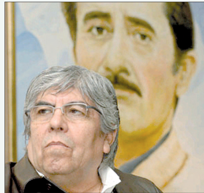
Moyano y Rucci. La política es el único ámbito en el cual los muertos siguen actuando.

En principio, no debe olvidarse que Moyano tiene encima una denuncia por sus vínculos,