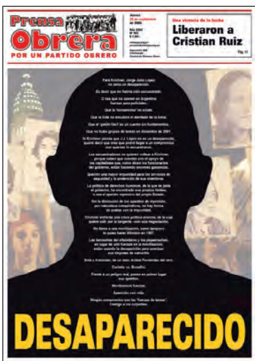
Prensa Obrera 965. 28 de septiembre de 2006