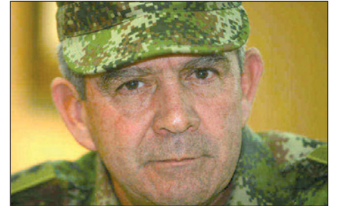
Mario Montoya, comandante del ejército colombiano

“Los comandos paramilitares no operan solos... ellos operan con los militares, y el hombre a cargo era el general Montoya” (ídem).