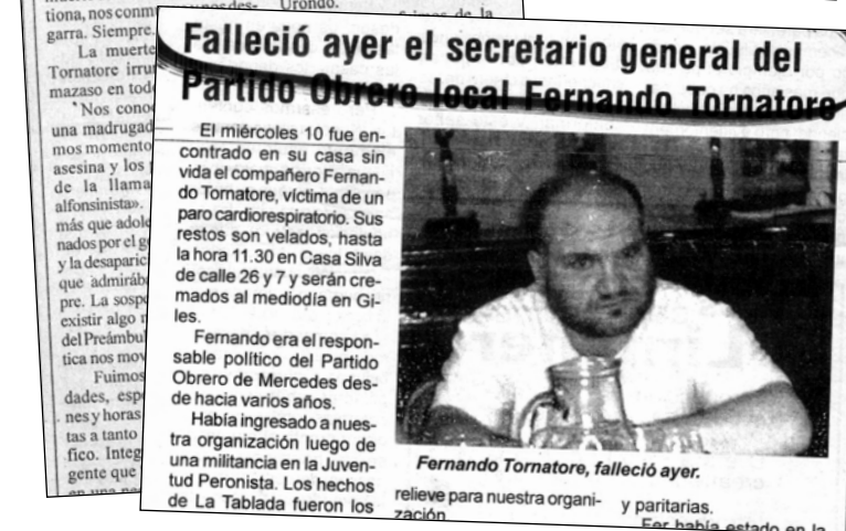
Los medios de Mercedes homenajearon la memoria de nuestro compañero.