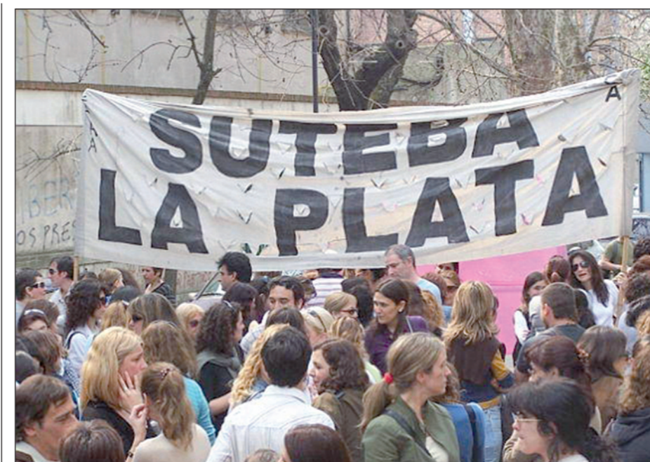
Una nueva provocación, luego de más de dos meses de lucha. Tenemos que ir a la huelga general.