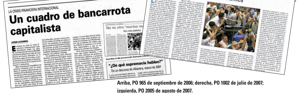
Arriba, PO 965 de septiembre de 2006; derecha, PO 1002 de julio de 2007; izquierda, PO 2005 de agosto de 2007.

Los diarios y los comentaristas, tan circunspectos hasta el momento, ahora rivalizan en títulos catastrofistas, pero no son capaces de diseñar una perspectiva. No tienen un análisis catastrofista, simplemente están asustadísimos; el problema no es el ‘viento de cola’ o el ‘viento de frente’ sino la combinación del derrumbe económico con las crisis políticas. Durante un par de años, el capital desafió a la ley del valor, inflando su valor más allá de su capacidad de reproducción real, pero la ley del valor se ha cobrado la afrenta a un precio enorme. Ha quedado de manifiesto que la ganancia capitalista es un objetivo muy estrecho para desenvolver productivamente la riqueza social acumulada. La crisis mundial plantea la reorganización social general sobre nuevas bases.