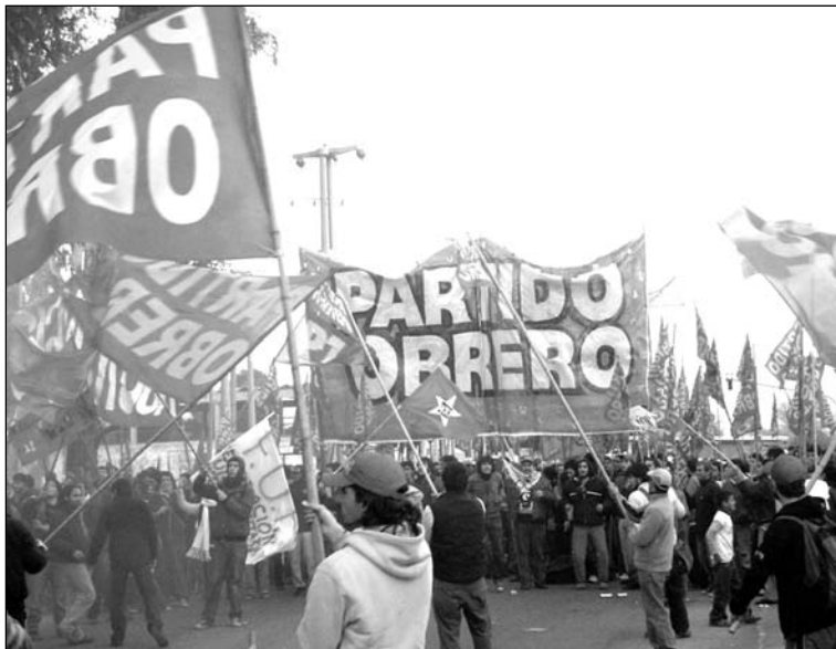
Manifestamos en San Luis.

Con esta posición llamamos a formar un bloque a todas las agrupaciones que tenían un punto de vista similar. Planteamos que todas las agrupaciones que teníamos una posición independiente debíamos luchar contra el vaciamiento político pactado por la Franja y el peronismo, al cual se sumaba la 'izquierda campestre'. Para dar esa batalla propusimos movilizarnos frente a la única instancia real del Congreso, la acreditación de los delegados y reali-