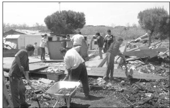
Campamento gitano incendiado en Nápoles.