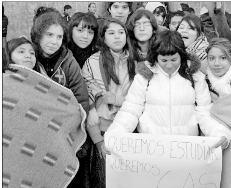
Los secundarios en defensa de la educación pública.