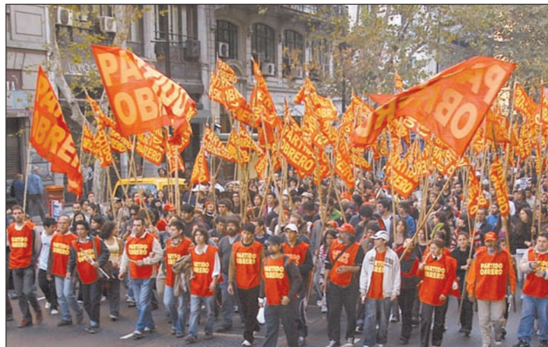
La columna del Partido Obrero marchando hacia Plaza de Mayo.

dicatos y hacer de esta plaza, la plaza de la clase obrera y el pueblo trabajador, histórico y políticamente independiente para llevar a la liberación nacional y social de nuestro pueblo.