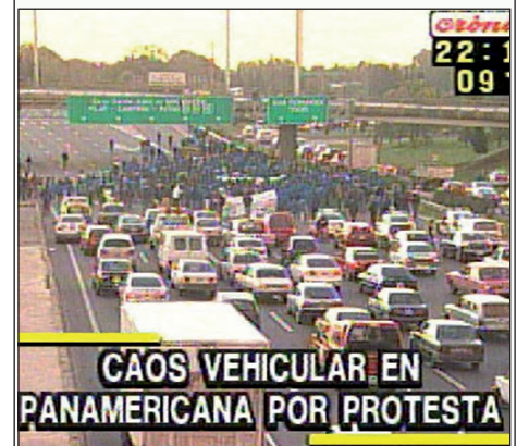
El corte de los obreros de Terrabusi, reflejado por Crónica TV.

Con la presencia de delegaciones de Fate, Parmalat, Stani, Suteba General Sarmiento, Pepsico, el Polo Obrero y la CCC, el corte se convirtió en una verdadera asamblea obrera que ocupó la totalidad de la Panamericana y recorrió, en los testimonios de los oradores, el conjunto de los conflictos que hoy se desarrollan en la zona norte.