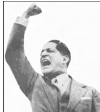
Arr.: una escena del Bogotazo; Izq.: Jorge Eliécer Gaitán

ca. Por eso en Colombia, actualmente, son asesinados más sindicalistas que en el resto del mundo en conjunto.