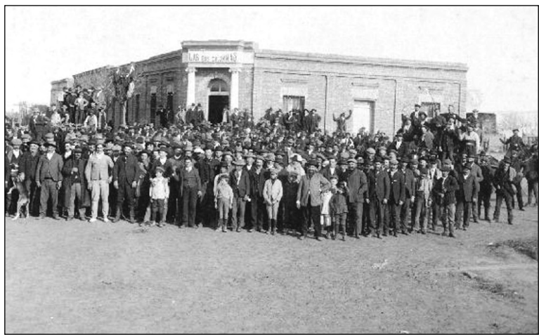
1913: chacareros santafesinos, los fundadores de la Federación Agraria.