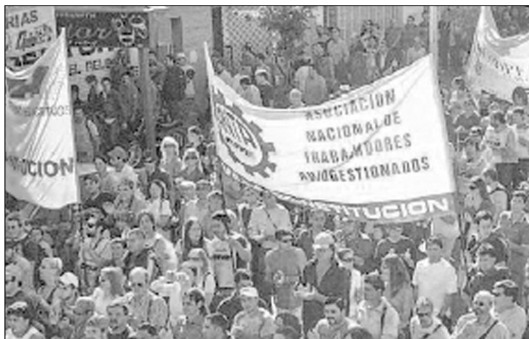
Villa Constitución: Movilización en repudio de la muerte de dos compañeros de Acindar. Después vinieron las muertes de los compañeros de Astilleros Río Santiago y Dema. Comisiones obreras de seguridad para impedir que siga la masacre de los "accidentes industriales".

Es urgente la formación de comisiones obreras de seguridad