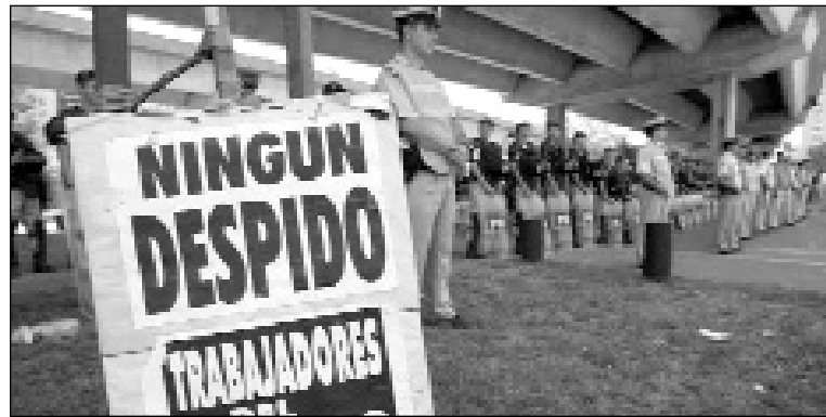
El campamento trasladado bajo la autopista (arr.). Las manos de los trabajadores contra la represión policial (der.).