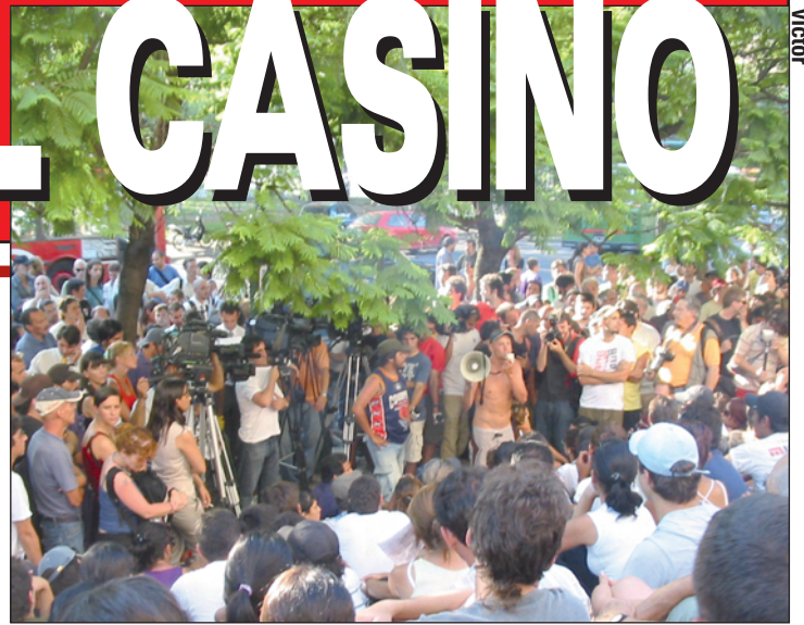
Lunes 14 en la Facultad de Ingeniería. La asamblea vota por unanimidad volver a la puerta del Casino luego de la represión de la Prefectura de Kirchner.

Ayacucho 448 C1026AAB Ciudad de Buenos Aires