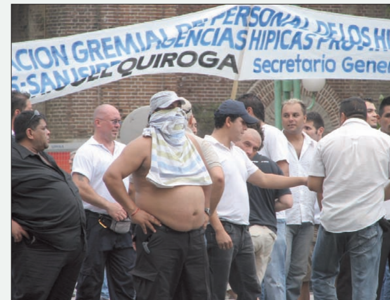
PRENSA TRABAJADORES DEL CASINO