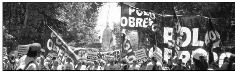
SECRETARÍA DE PRENSA PO

No sólo montamos una tribuna masiva desde la Plaza de Mayo, sino que hubo movilizaciones, cortes y acampes en todo el país, desde unos días antes de la marcha. El viernes, más de mil com-