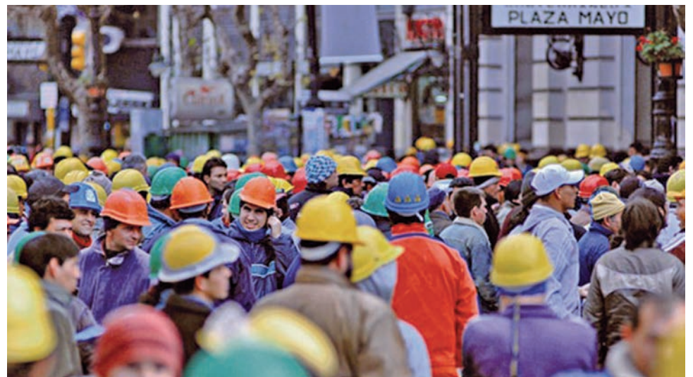
Piquetes de los obreros de la construcción, del casino y el paro del subte. Fin de año de lucha.