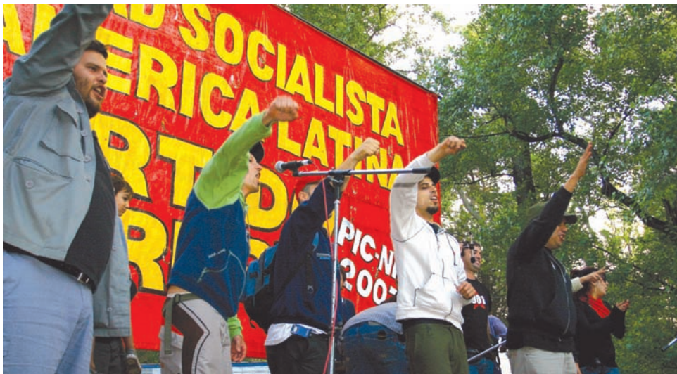
Los luchadores del Casino presentes en el pic-nic.