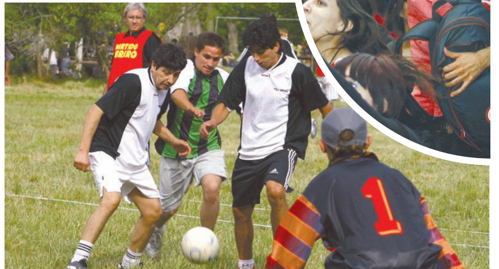
Fútbol de mayores, sub 13 y mujeres, voley y ajedrez: deportes para todos los gustos y edades.